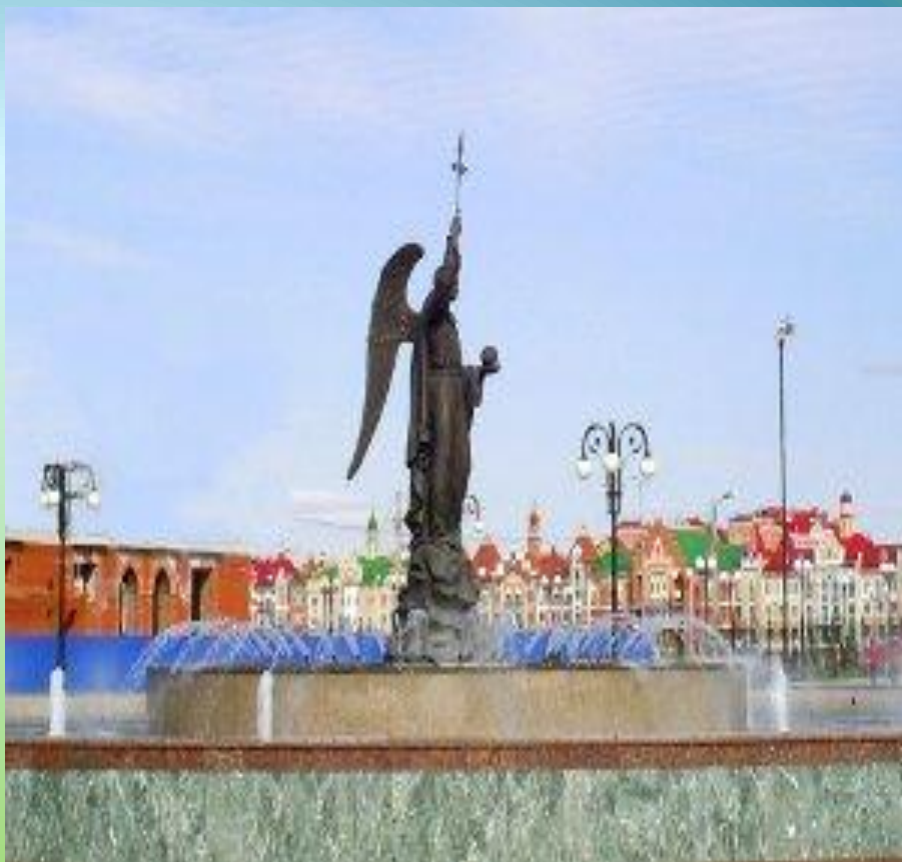
14. Фонтан "Архангел Гавриил".