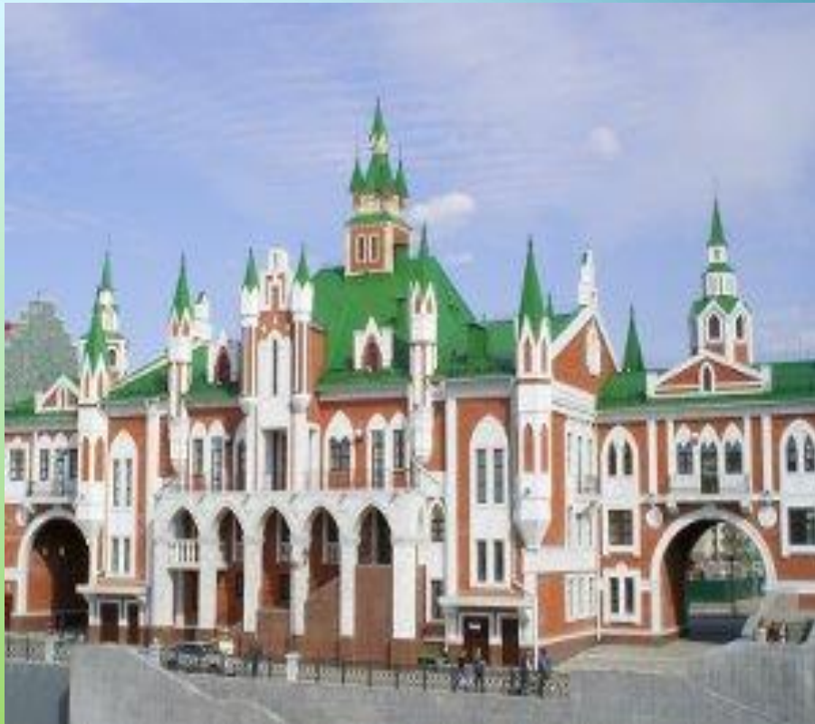
11. Спасская башня