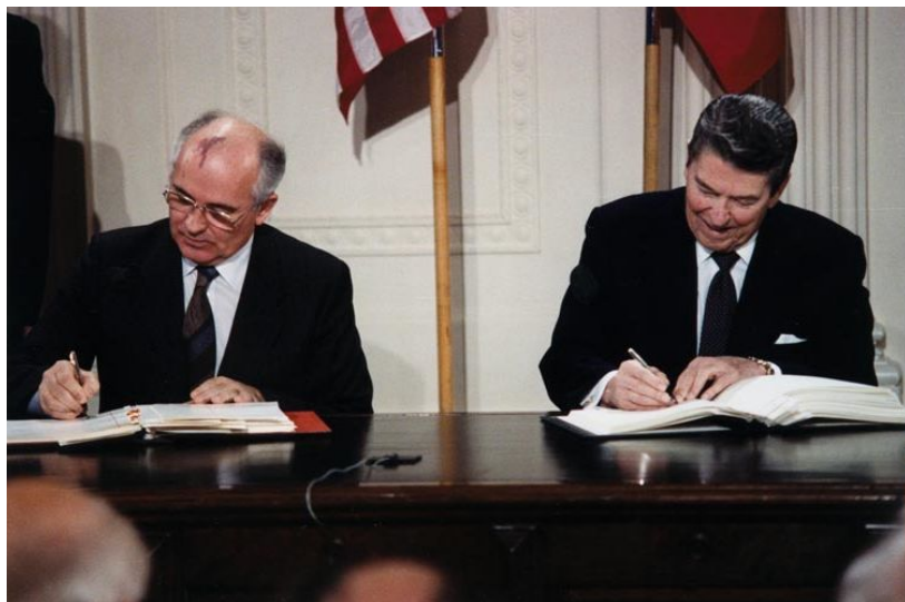
М. Горбачев и Р. Рейган подписывают Договор РСМД

Впервые от переговоров об ограничении вооружений две сверхдержавы перешли к ликвидации этого оружия