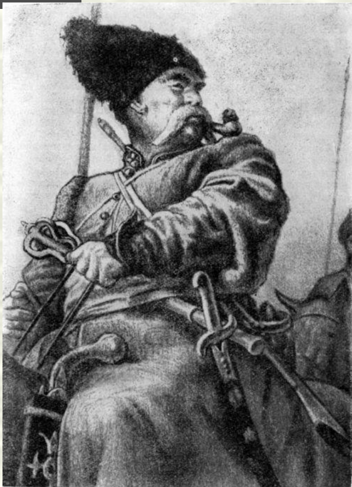
Тарас Бульба. С рисунка Е. Кибрика