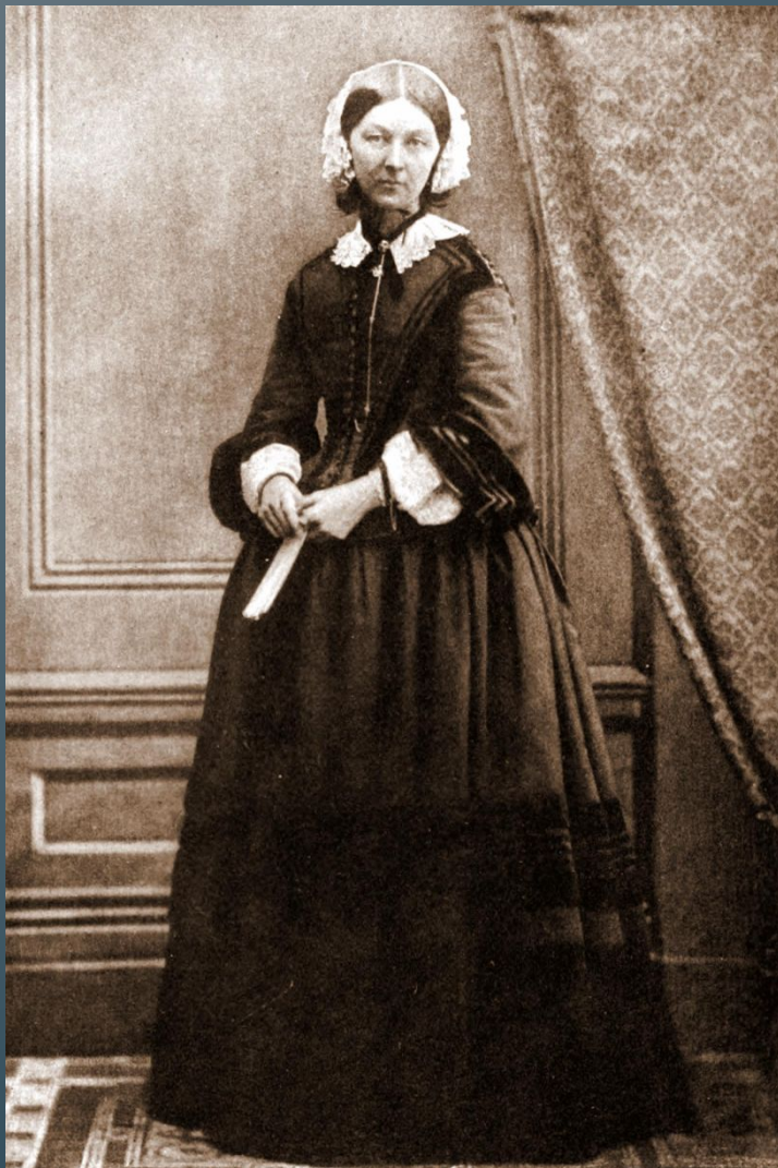
Флоренс Найтингейл (12 мая 1820, Флоренция, Великое герцогство Тосканское — 13 августа 1910, Лондон, Великобритания)