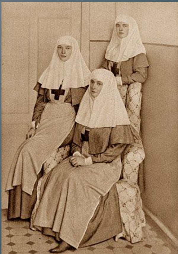
Сестры милосердия — Великая Княжна Татьяна Николаевна и Императрица Александра Фёдоровна — сидят, Великая Княжна Ольга Николаевна — стоит.