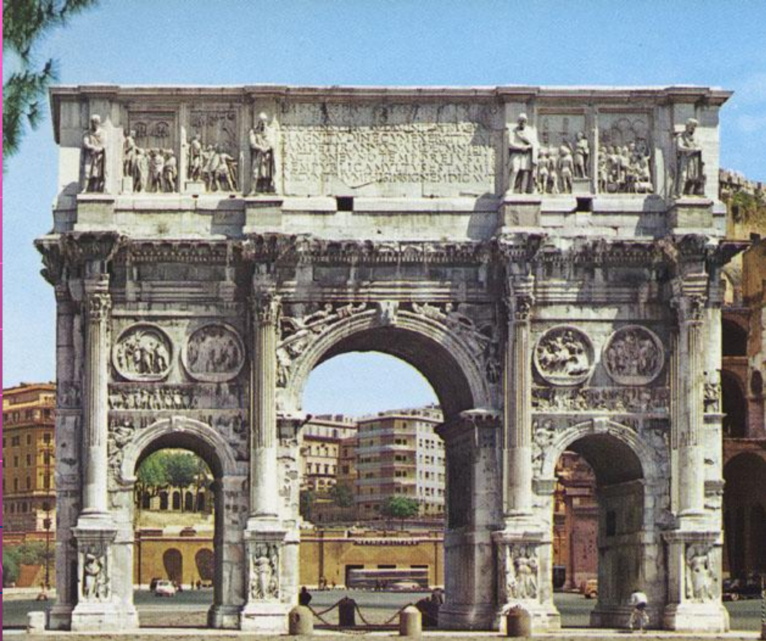
триумфальная арка Константина