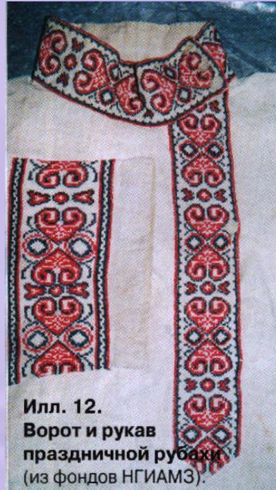
Илл. 12. Ворот и рукав праздничной рубашки.

Во второй половине XIX - начале XX века нижегородский мужской костюм представлял собой смешение народной традиции и городской моды.