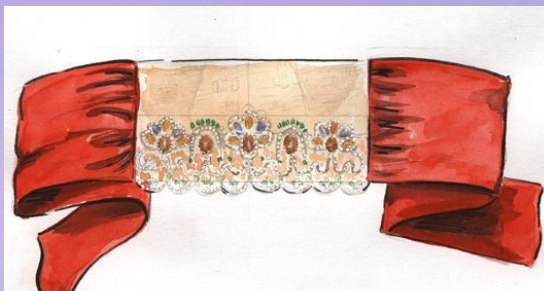
Нижегородская девичья повязка

Костюм девушки нижегородской губернии состоял из рубахи, шелкового сарафана, шелковой или парчовой распашной одежды, называемой кафтанчиком. Голова украшалась девичьей повязкой. Весь ансамбль дополнялся нагрудным праздничным украшением "ожерельем»