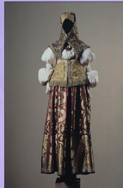
Праздничный костюм замужней женщины нижегородской губернии XIX века

Костюм девушки нижегородской губернии состоял из рубахи, шелкового сарафана, шелковой или парчовой распашной одежды, называемой кафтанчиком. Голова украшалась девичьей повязкой. Весь ансамбль дополнялся нагрудным праздничным украшением "ожерельем»