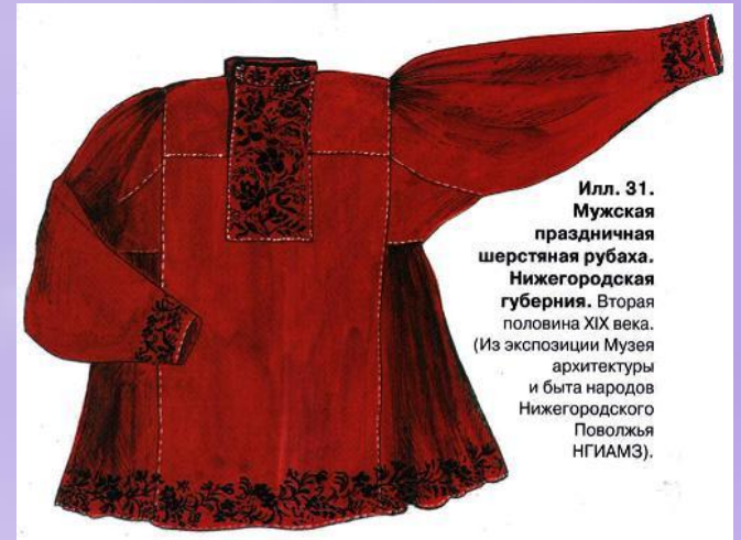
Илл. 31. Мужская праздничная шерстяная рубашка. Нижегородская губерния. Вторая половина XIX века. (Из экспозиции Музея архитектуры и быта народов Нижегородского Поволжья НГИАМЗ).

Во второй половине XIX - начале XX века нижегородский мужской костюм представлял собой смешение народной традиции и городской моды.