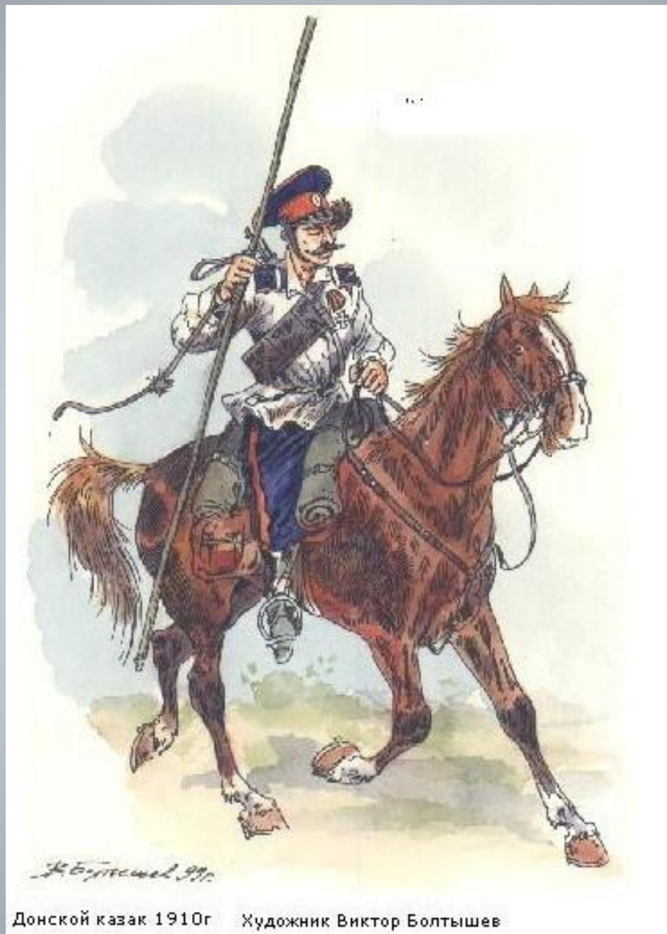
Донской казак 1910г. Художник Виктор Болтышев