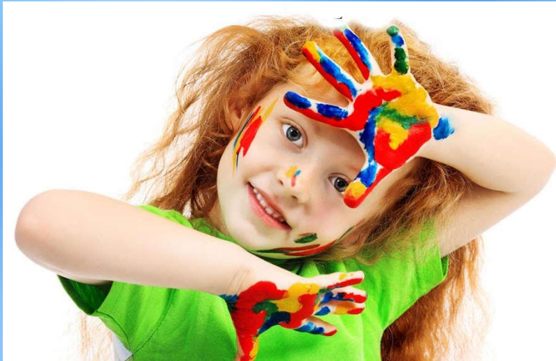
Гармоничный тип развития