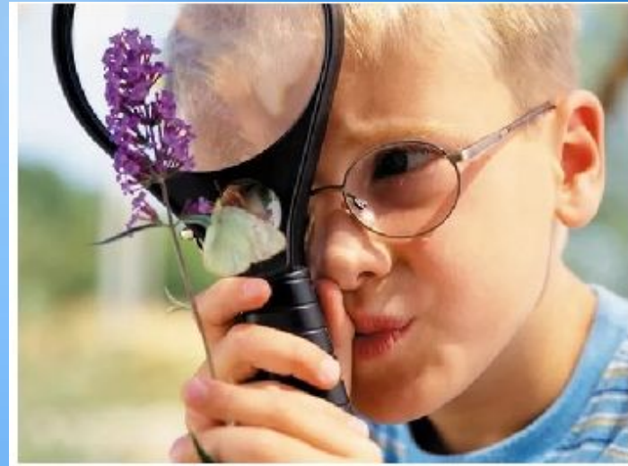
Дисгармоничный тип развития