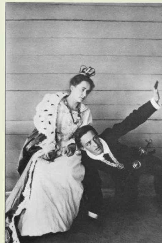
Домашний театр Гамлет

Зима 1897г. Блок мечтает стать актером, он увлечен игрой В. П. Далматова и М. А. Дальского, занимается декламацией и мелодекламацией, участвует в любительских спектаклях. Изучает роль Ромео. Декламирует стихи А. А. Фета, А. К. Толстого, Я.П. Полонского, А. Н. Апухтина.