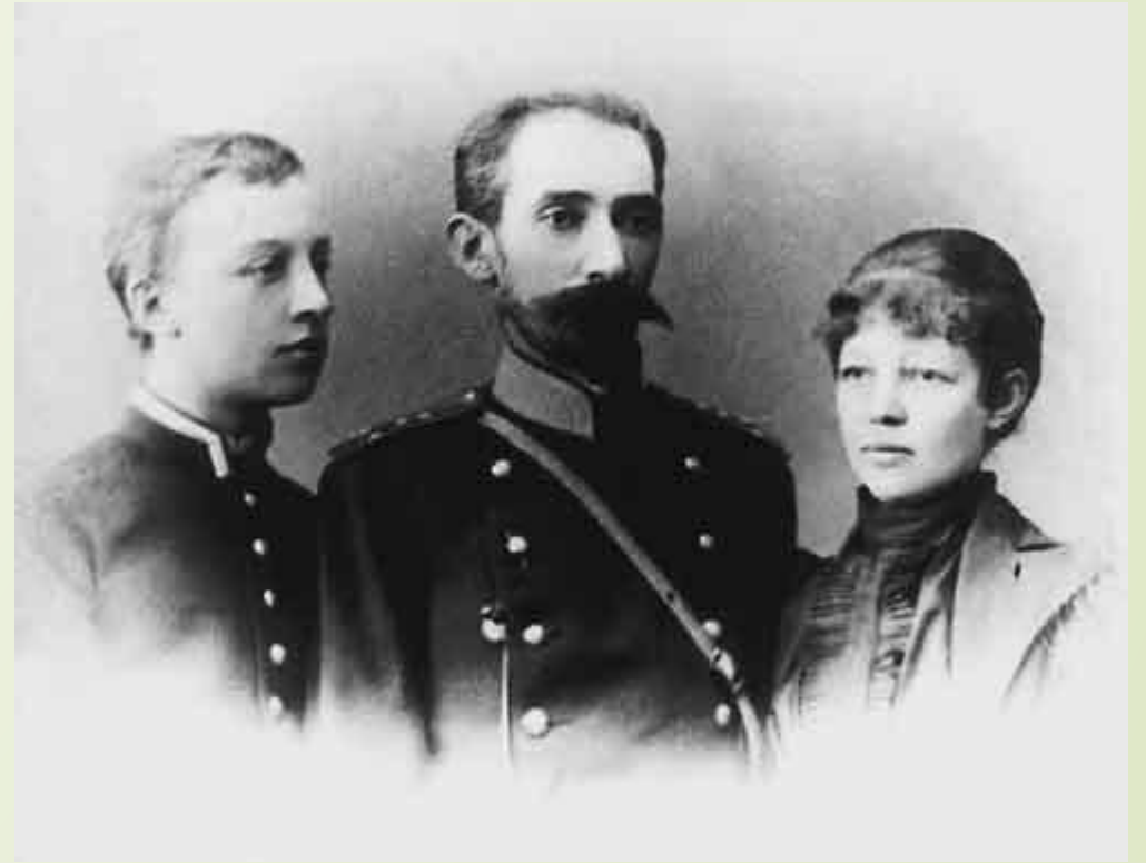
А.Блок с матерью и отчимом. Петербург. 1895