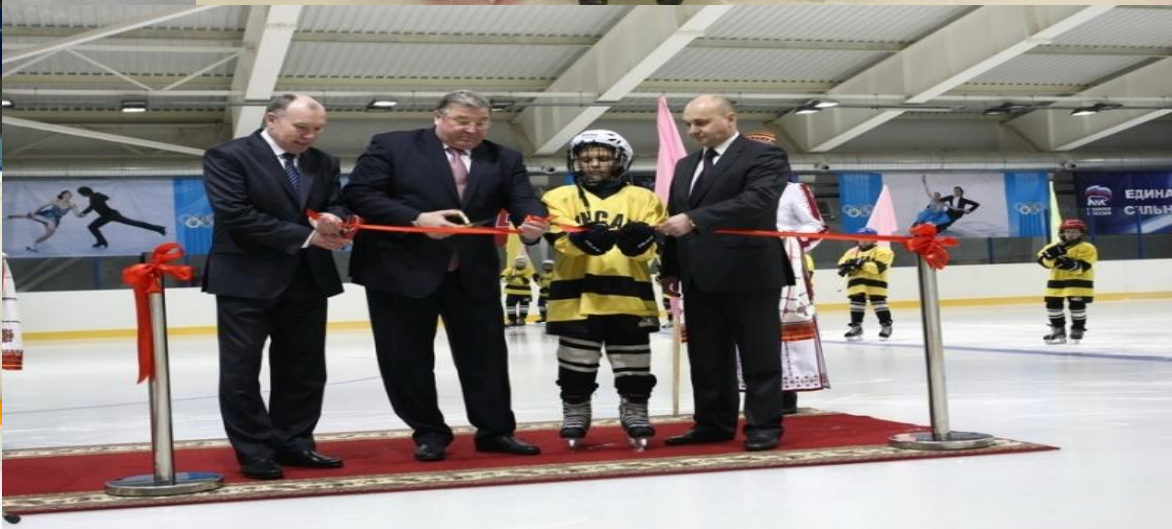
Открытие Ледовой арены