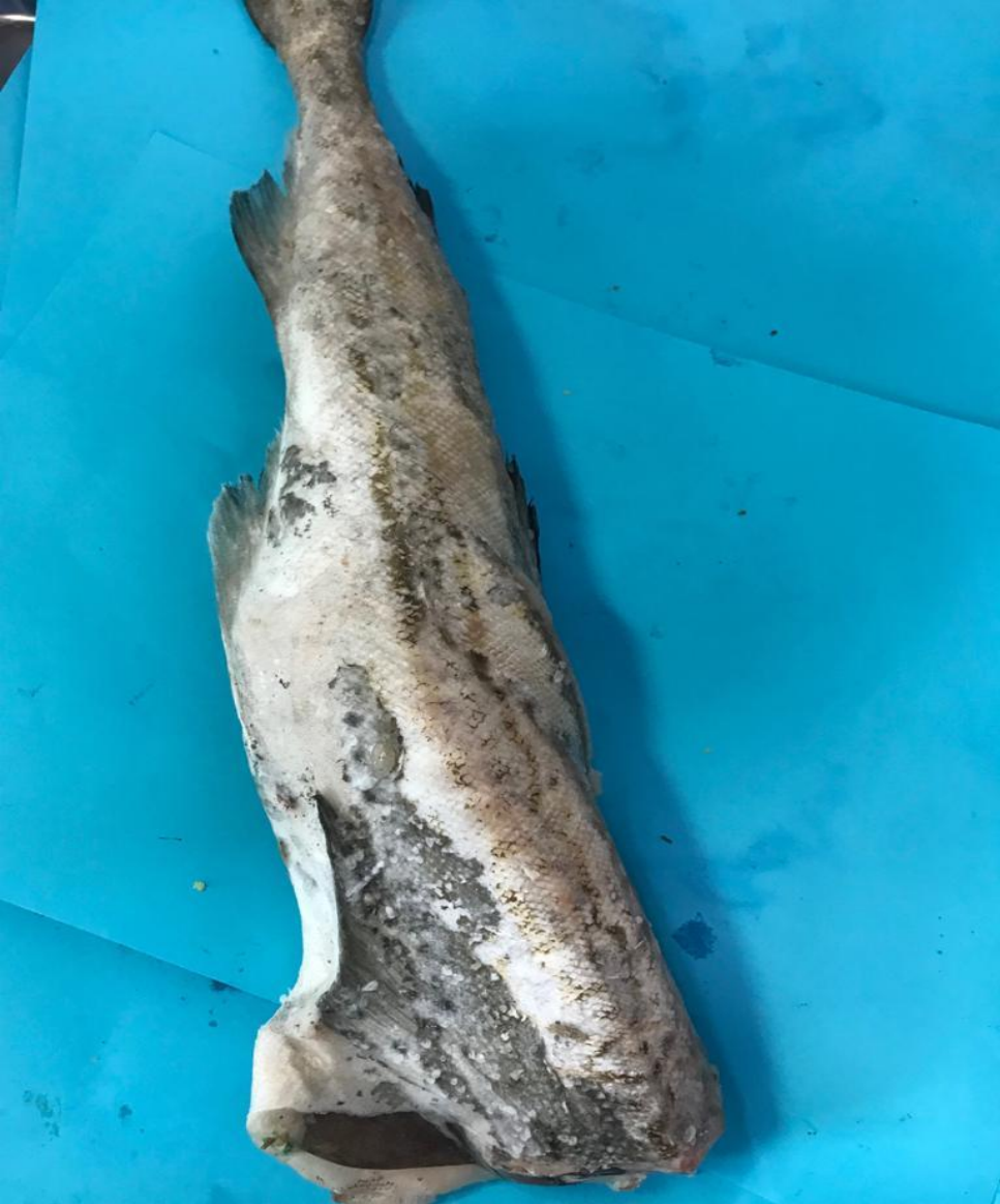
Минтай 198 р/кг