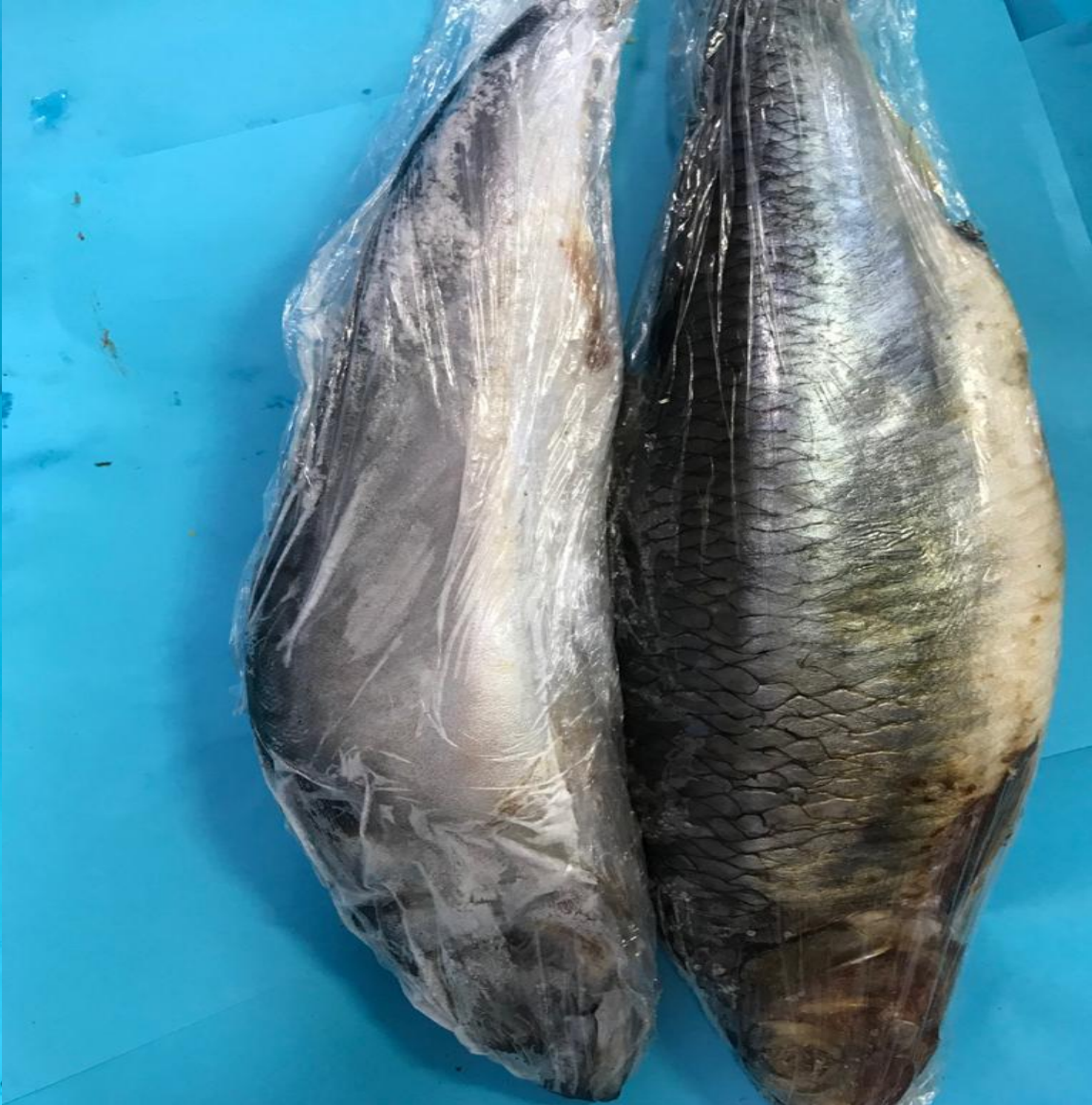
Скумбрия 210 р/кг Селедь 148 р/кг