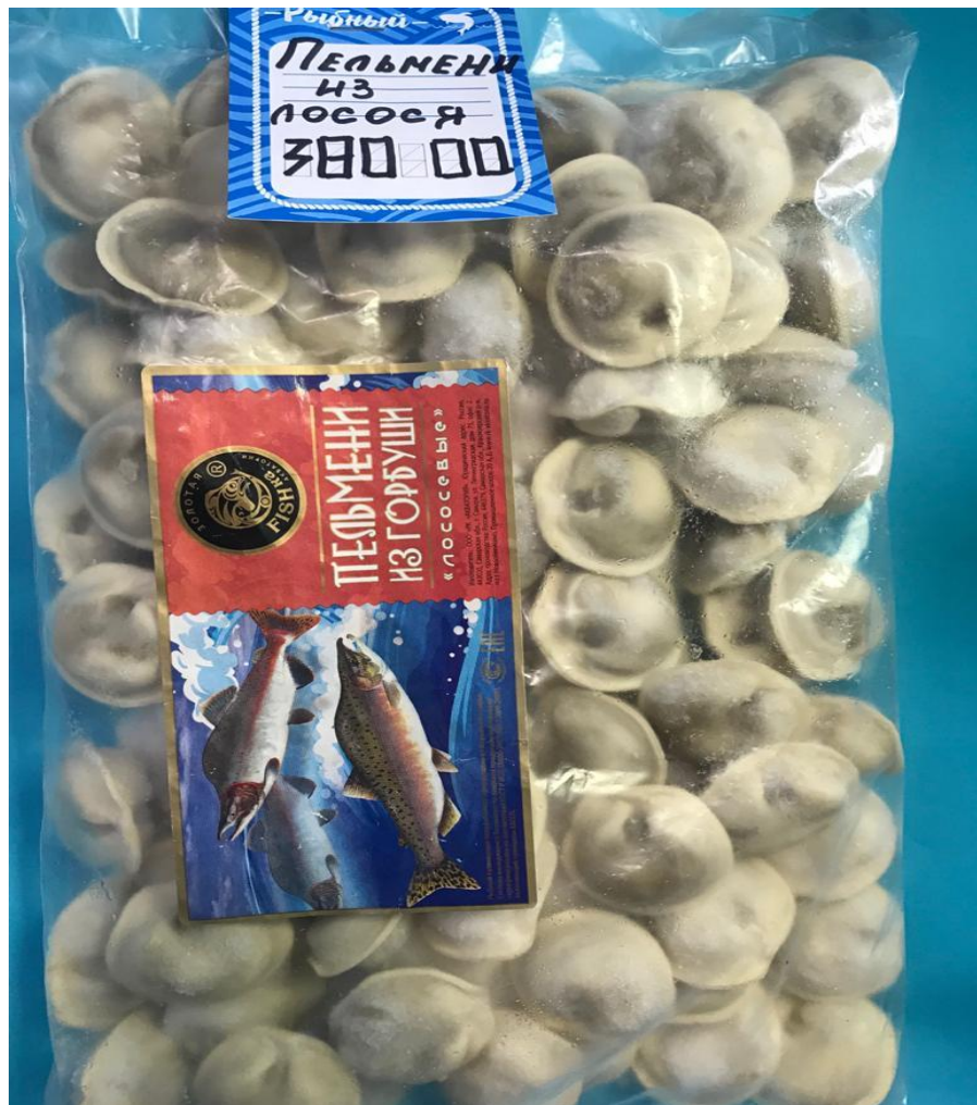
Пельмени из лосося 380р.