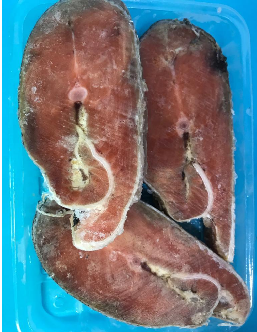
стейк Кеты 400 р/кг