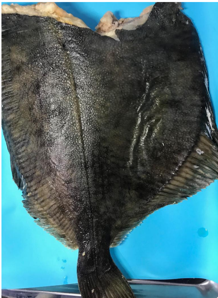
Камбала 227 р/кг