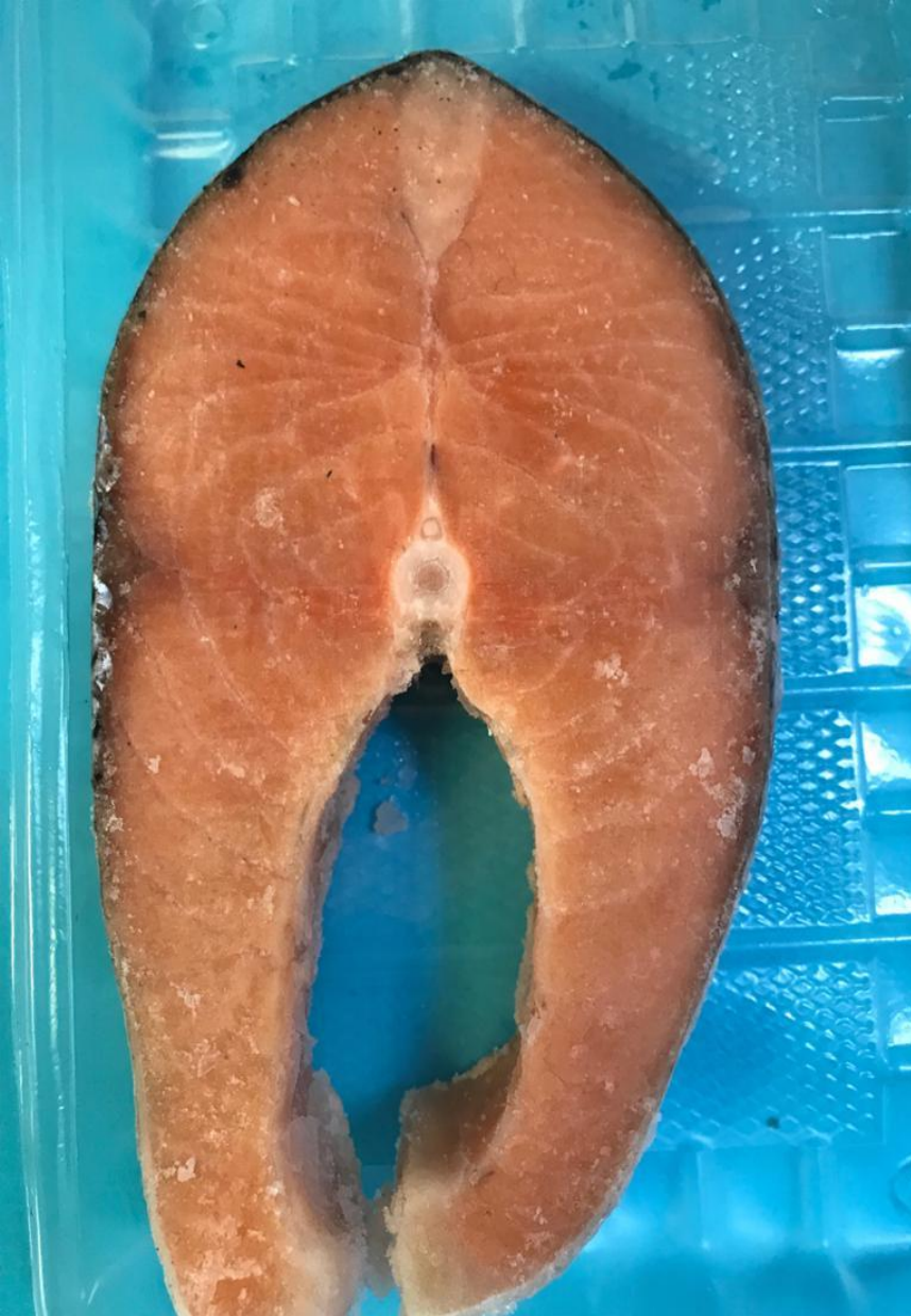
стейк Семги 1380 р/кг