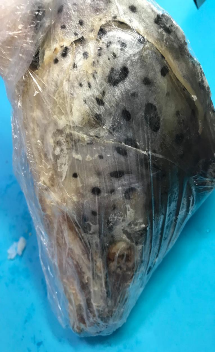
ГОЛОВЫ Лосося 230 р/кг