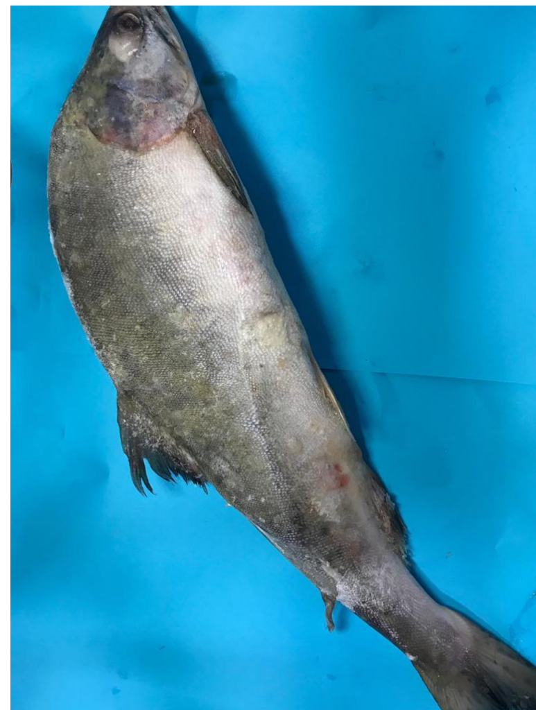
Горбуша 208 р/кг