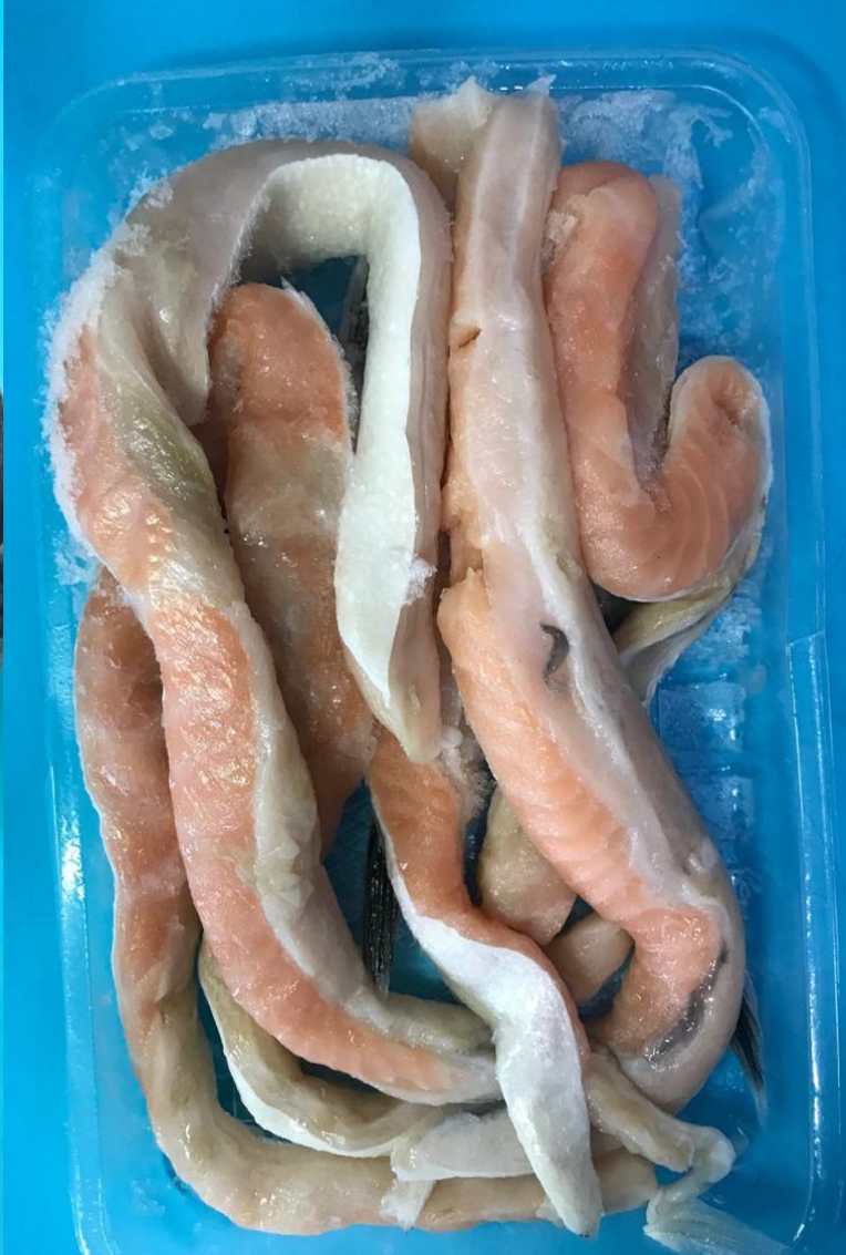
брюшки Форели 525 р/кг