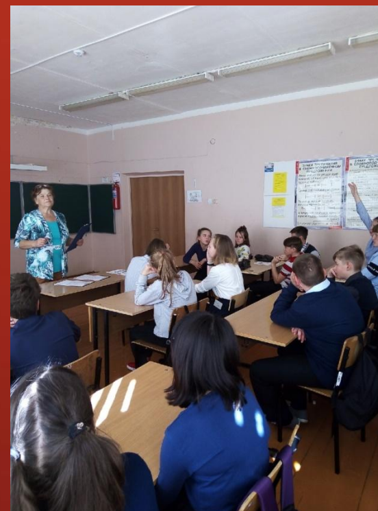
День солидарности в борьбе с терроризмом.