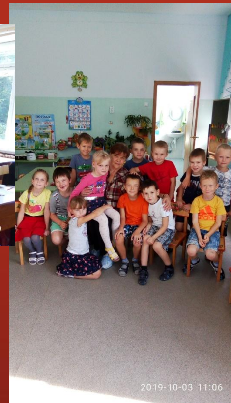
Полезные и вредные микробы и вирусы.