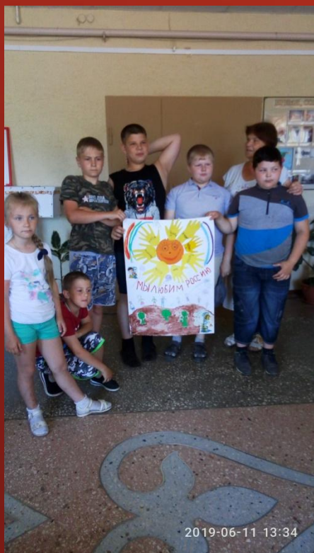
Творческий плакат своими руками "Мы любим Россию"

Живое слово не только дает знания (раскрывает глаза на вещи и явления), но и берет, так сказать, за сердце, побуждает волю.