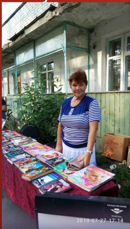
День села Сарафоново. Буккросинг

Профессия библиотекаря, как и профессия педагога, журналиста, артиста, требует искусства владения речью.