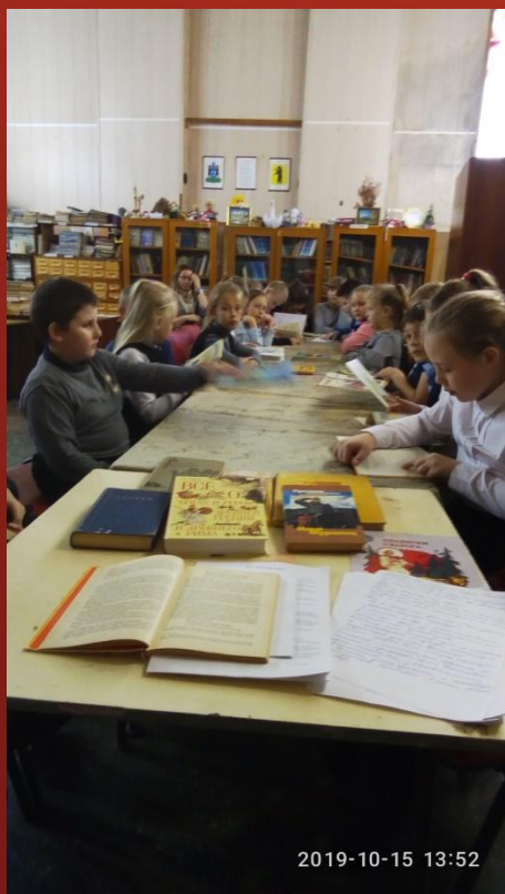
Богатыри земли Русской.

Встречи- самые разнообразные, всем по нраву.