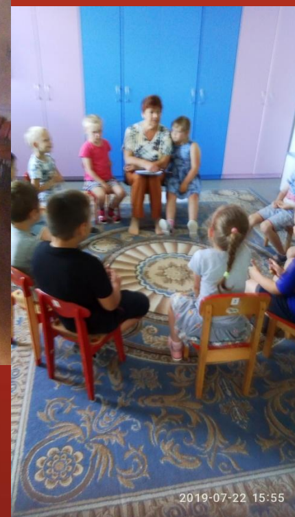
Экологическая сказка «Спасенный птенчик»