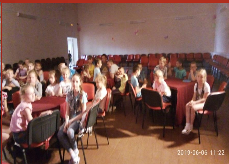
Мероприятие викторины по сказкам Пушкина «Там на неведанных дорожках»