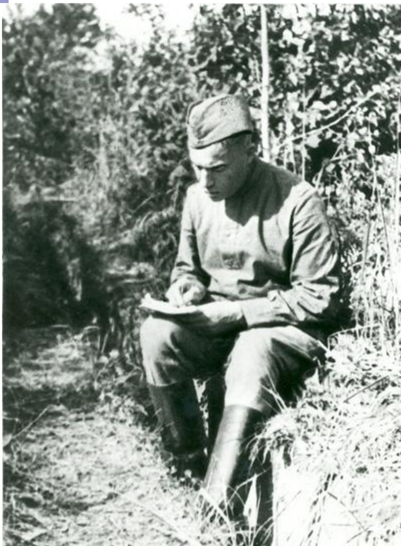
1943 г. Во время поездки на фронт в составе группы писателей