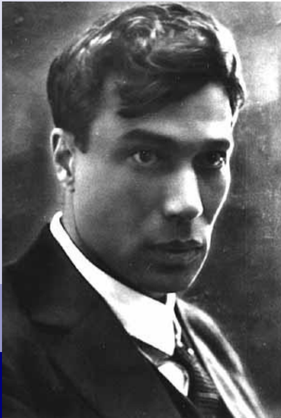
Борис Леонидович Пастернак (1890 – 1960)