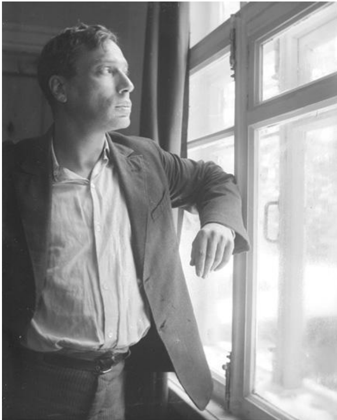
1936 г. Переделкино.

В 1914 вышла первая книга стихов «Близнец в тучах».