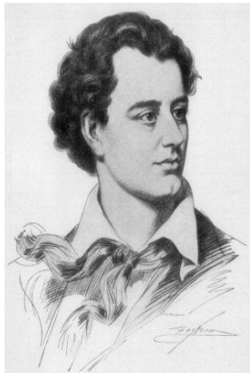
ДЖОРДЖ ГОРДОН БАЙРОН