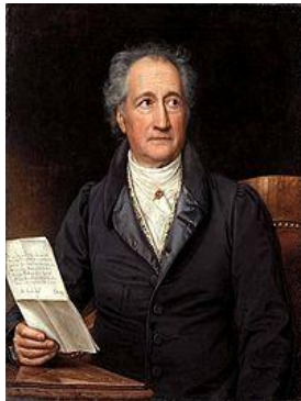
Иоганн Вольфганг фон Гёте