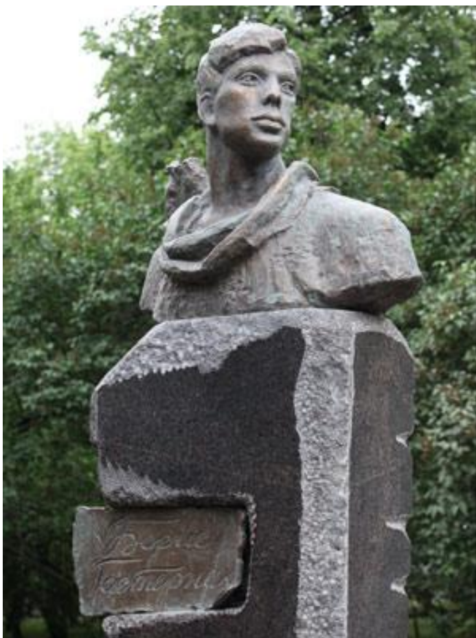
Памятник поэту Борису Пастернаку в Перми. Скульптор Елена Мунц

Умер Пастернак 30 мая 1960 от рака легких в Переделкине.