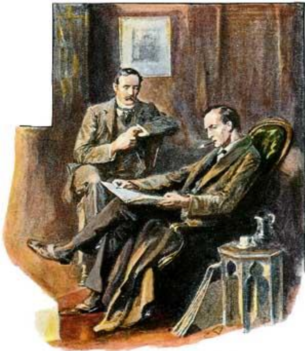
Шерлок Холмс и доктор Ватсон. Иллюстрация к рассказу А. Конан Дойля „Пустой дом”