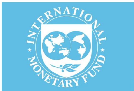
Международный валютный фонд

Институт, занимающийся финансированием и кредитованием разных стран, содействующий мировой торговле, оказывающий помощь в стабилизации финансовой системы развивающихся стран