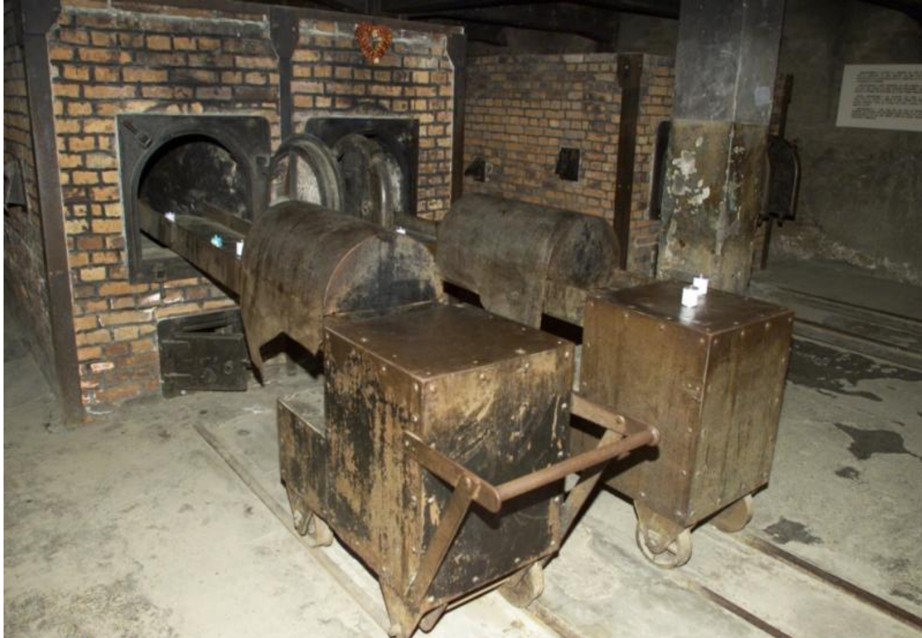
Печи, в которых сжигали людей.