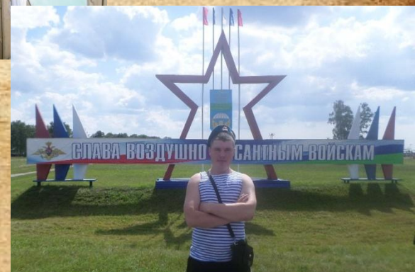
Фото: город Омск, пос. Светлый 242 учебный центр