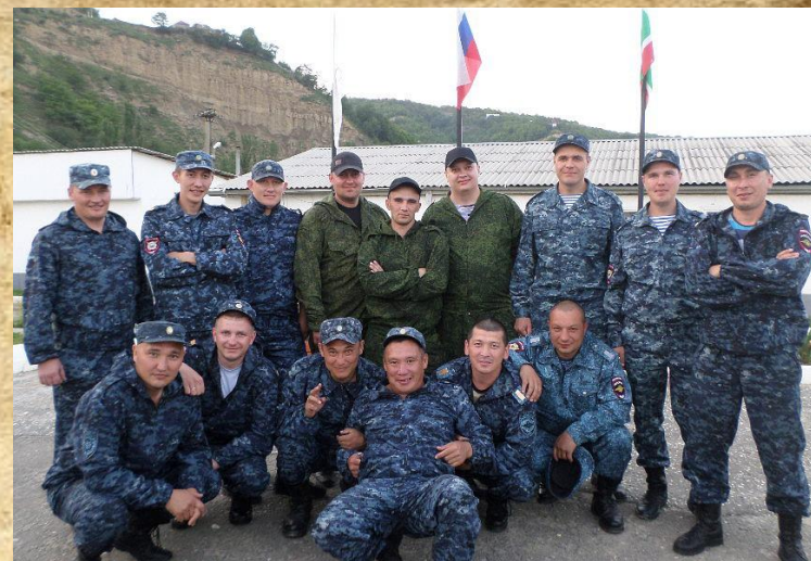
Фото: 13 июня 2013г. Омский отряд МВД