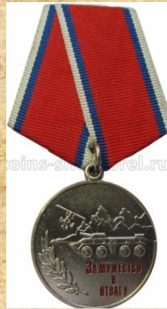
Фото: 23 мая 2015г.