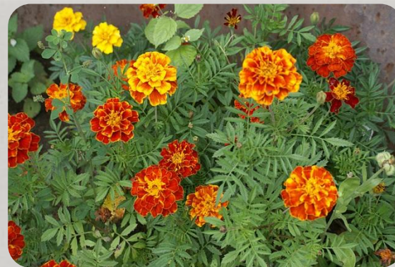
Высадка рассады в открытый грунт