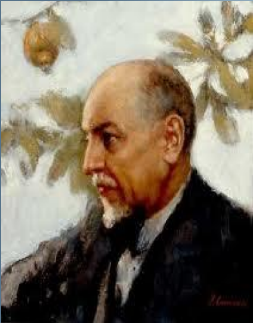
Луиджи Пиранделло (1867-1936)

благодаря новелле «Черепаша», которую написал