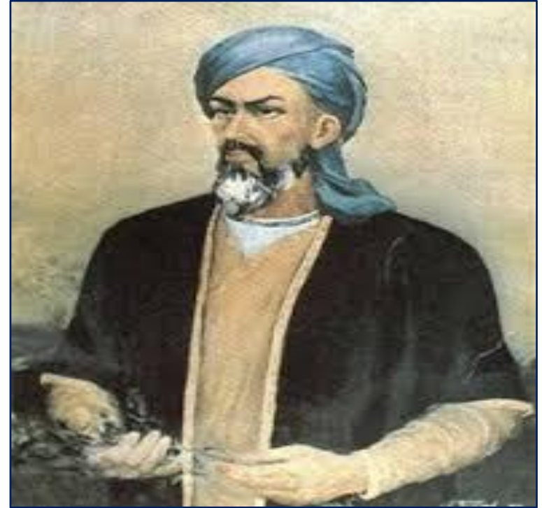
Авиценна Арабский учёный