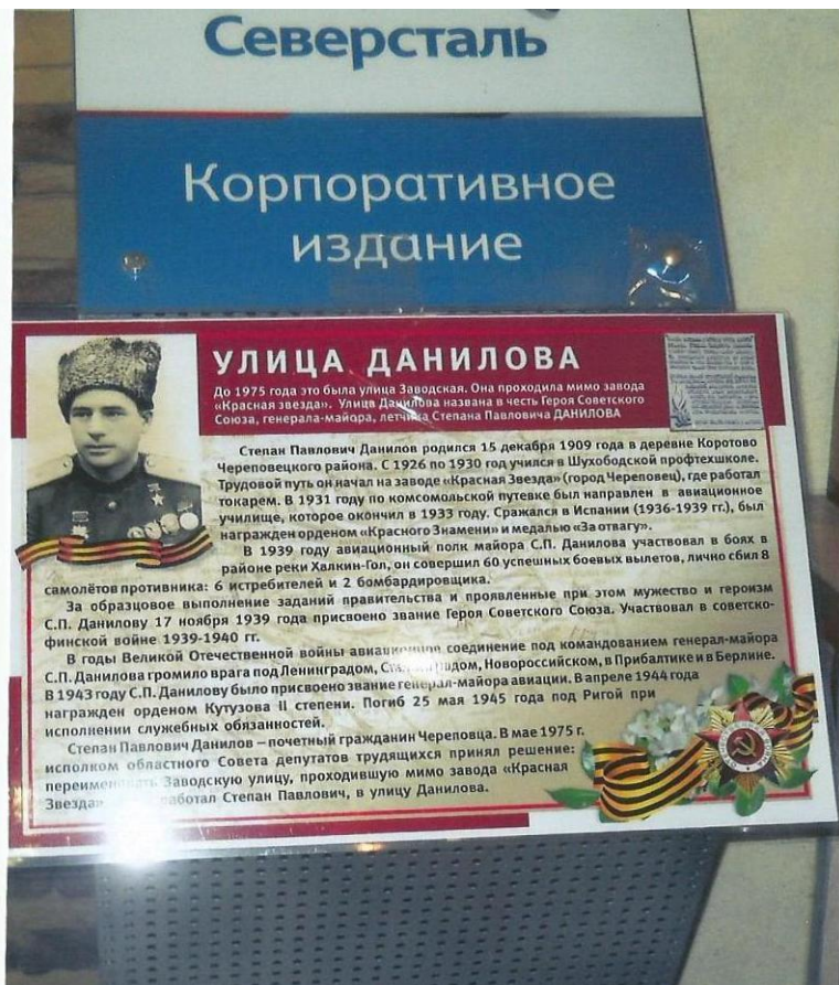
Плакат в санатории «Родник»