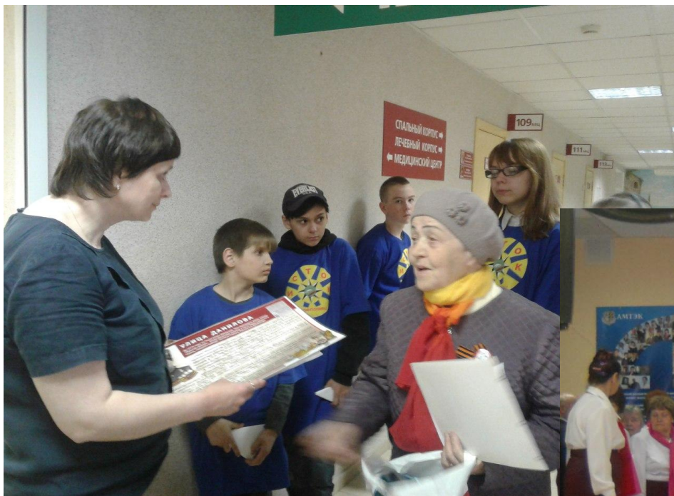
Хор ветеранов комсомола