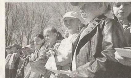
◆ Акция «Улица героя» проходит в нескольких череповецких учебных заведениях.