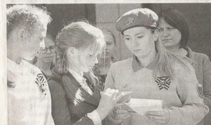
◆ Череповецкие юнармейцы вручили жителям улицы Краснодонцев конверты-треугольники.