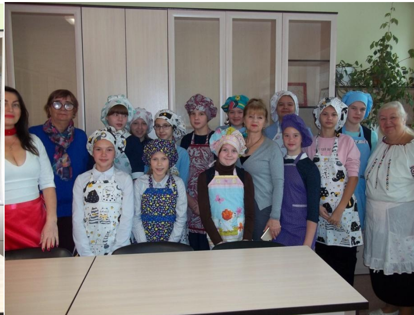
Карельская и молдавская кухня