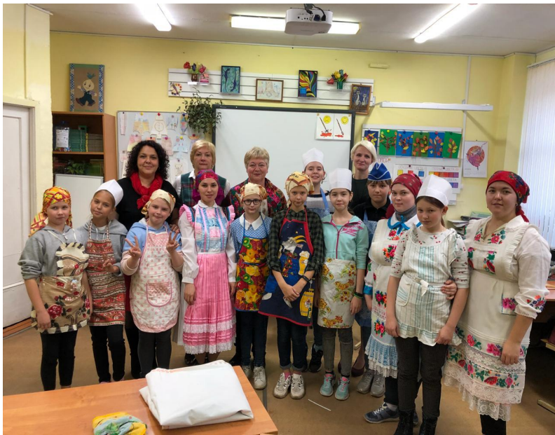
Грузинская и марийская кухня