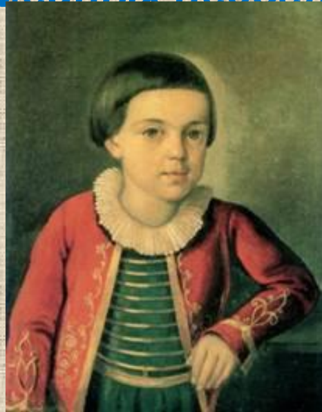
М. Ю. Лермонтов в детстве.