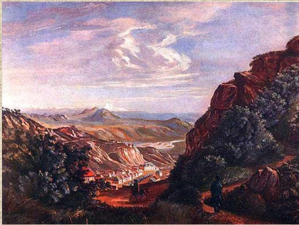
М. Ю. Лермонтов «Вид Пятигорска».

В 1840 году за дуэль с сыном французского посланника де Барантом М. Ю. Лермонтова вновь ссылают на Кавказ.