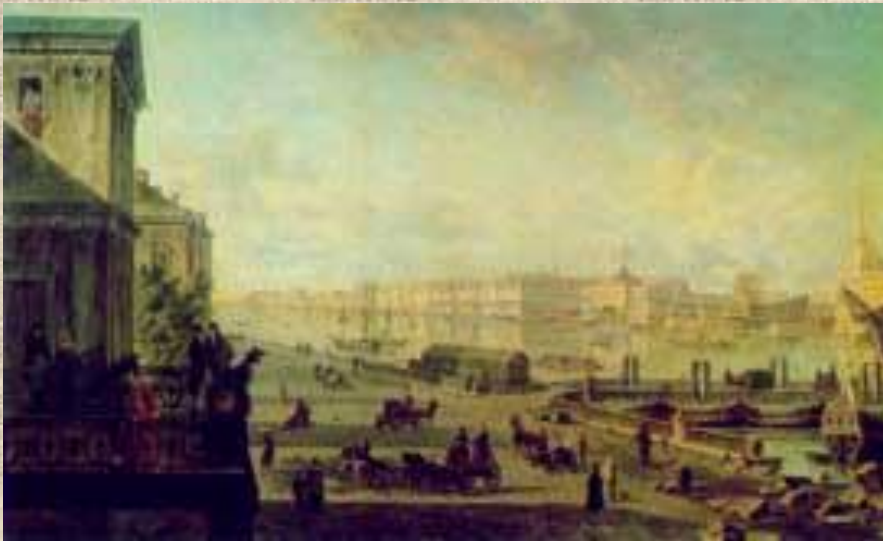
Петербург. 1820-е гг.

Оставив университет, Лермонтов в 1832 году переезжает в Петербург и поступает в Школу гвардейских подпрапорщиков и кавалерийских юнкеров; выпущен корнетом Лейб-гвардии гусарского полка в 1834 году.