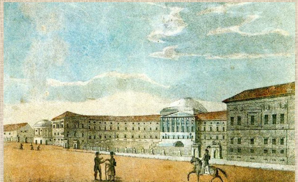
Московский университет. Неизвестный художник. 1820-е