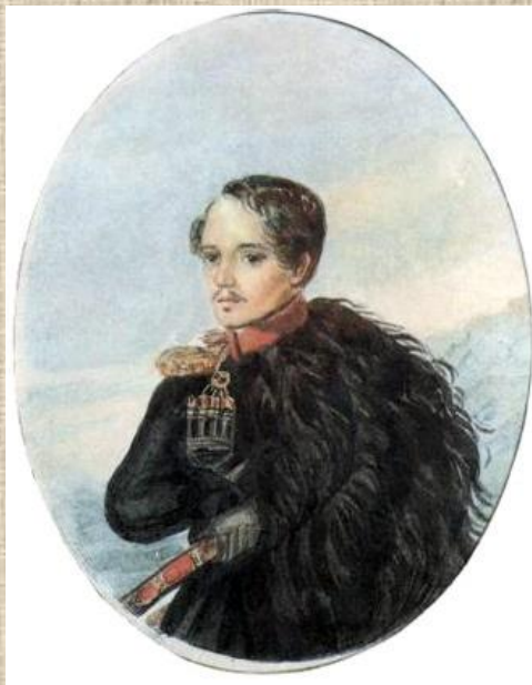
М. Ю. Лермонтов. Автопортрет.

В феврале 1837 года за стихотворение "Смерть поэта" М. Ю. Лермонтов был переведен в Нижегородский драгунский полк на Кавказ.