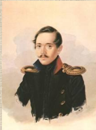
М.Ю.Лермонтов в сюртуке лейб-гвардии Гусарского полка. Акварель А.И.Клюндера.