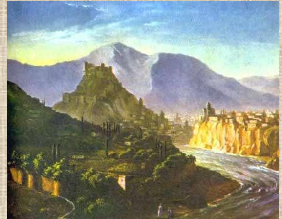
М. Ю. Лермонтов «Вид Тифлиса».