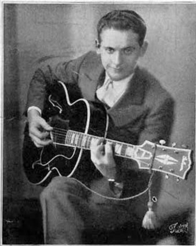
RHUBARB RED Over WJJD, Chicago

Саме під цим псевдонімом в 1936 році вийшла перший запис Леса (він грав на акустичній гітарі, а співала блюзова виконавиця Georgia White). Правда, ім'я "Лес Пол" до того моменту вже існувало. Воно з'явилося в 1934 році в Чикаго, куди перебрався оркестр Джо Волвертона (бо саме Чикаго був на початку 30-х центром музичної культури). Там Лес часто запрошували виступати в радіопередачах (в ті часи музика на радіо виконувалася наживо), і він швидко став зіркою і як джазовий гітарист