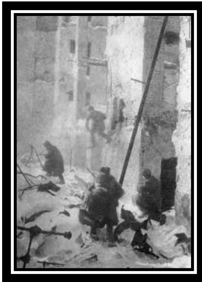
На фото: Уличные бои в Сталинграде.