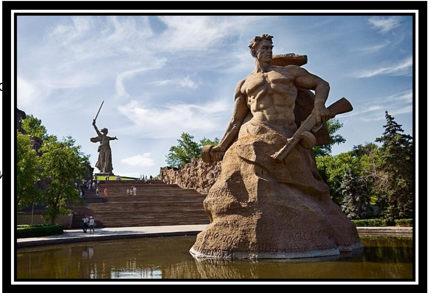
На фото: Мамаев Курган

Мамаев курган расположен в Центральном районе города Волгограда, где во время Сталинградской битвы происходили ожесточённые бои (особенно в сентябре 1942 года и январе 1943) продолжительнос тью 200 дней.