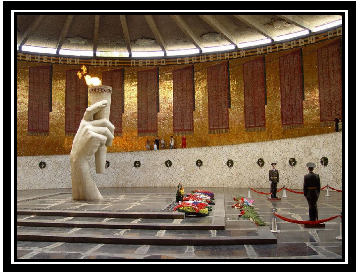
на фото. Вечный огонь

Мамáев кургáн расположен в Центральном районе города Волгограда, где во время Сталинградской битвы происходили ожесточённые бои (особенно в сентябре 1942 года и январе 1943) продолжительнос тью 200 дней.