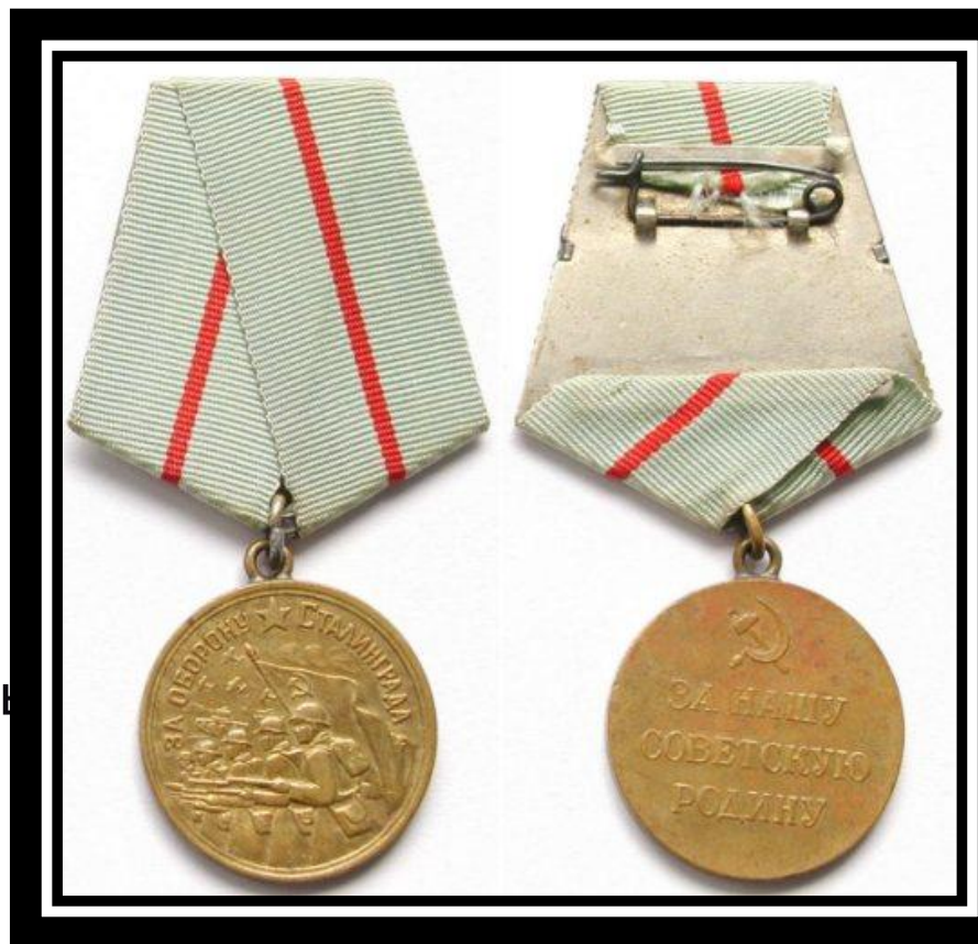
На фото: Медаль «За оборону Сталинграда»

По состоянию на 1 января 1995 года медалью «За оборону Сталинграда» награждено приблизительно 759 561 человек.