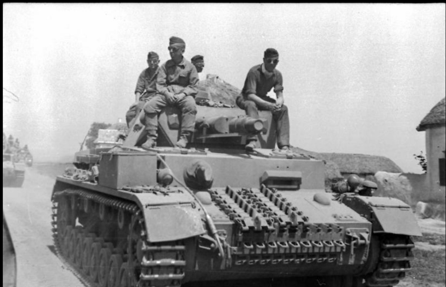
Juni 1942