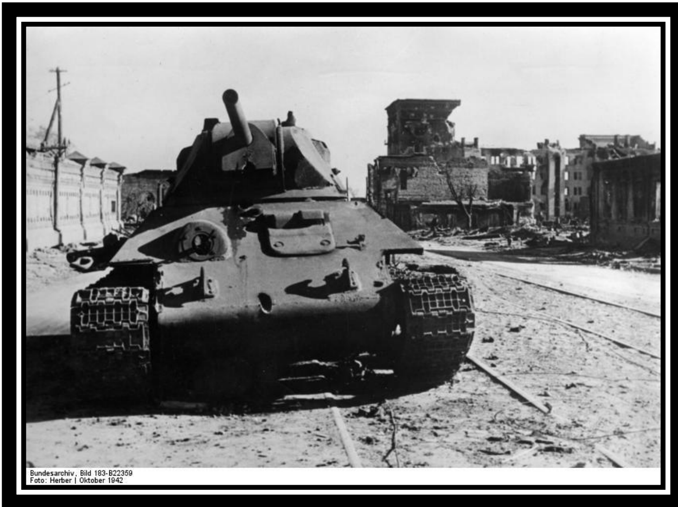
Bundesarchiv, Bild 183-B22359 Foto: Herber | Oktober 1942