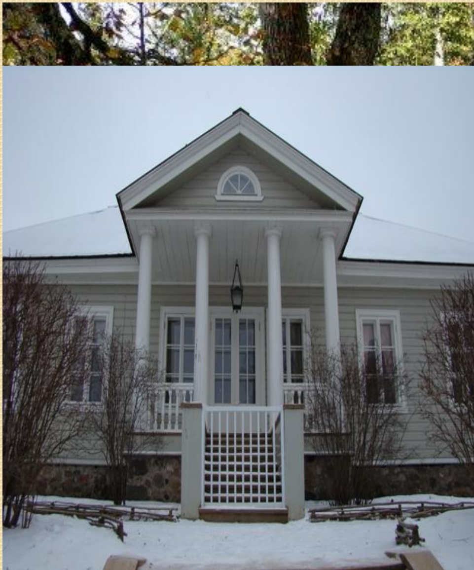
Пушкинские горы. Усадьба Михайловское.