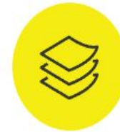
Постельное, столовое, туалетное и кухонное белье