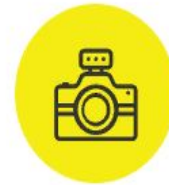
Фотоаппараты и лампы-вспышки