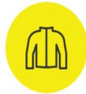
Предметы одежды из кожи