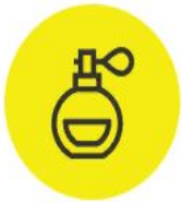
Духи и туалетная вода