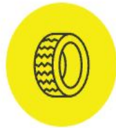
Шины и автопокрышки