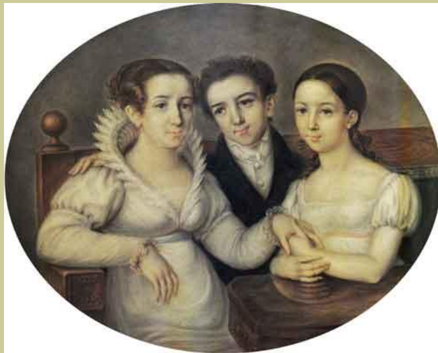
М. Глинка с матерью и сестрой