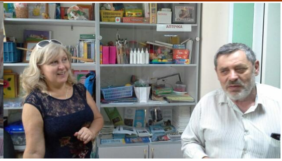
Знакомство с опытом работы ВРОО АРДИ «Свет» в г. Владимире и в Мурманске