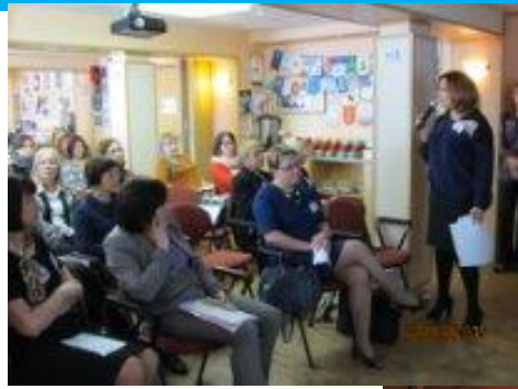
Центр «Вверх» в Мурманске