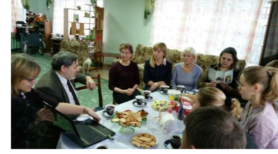
Знакомство с опытом работы МОО «Старшие братья Старшие сестры»