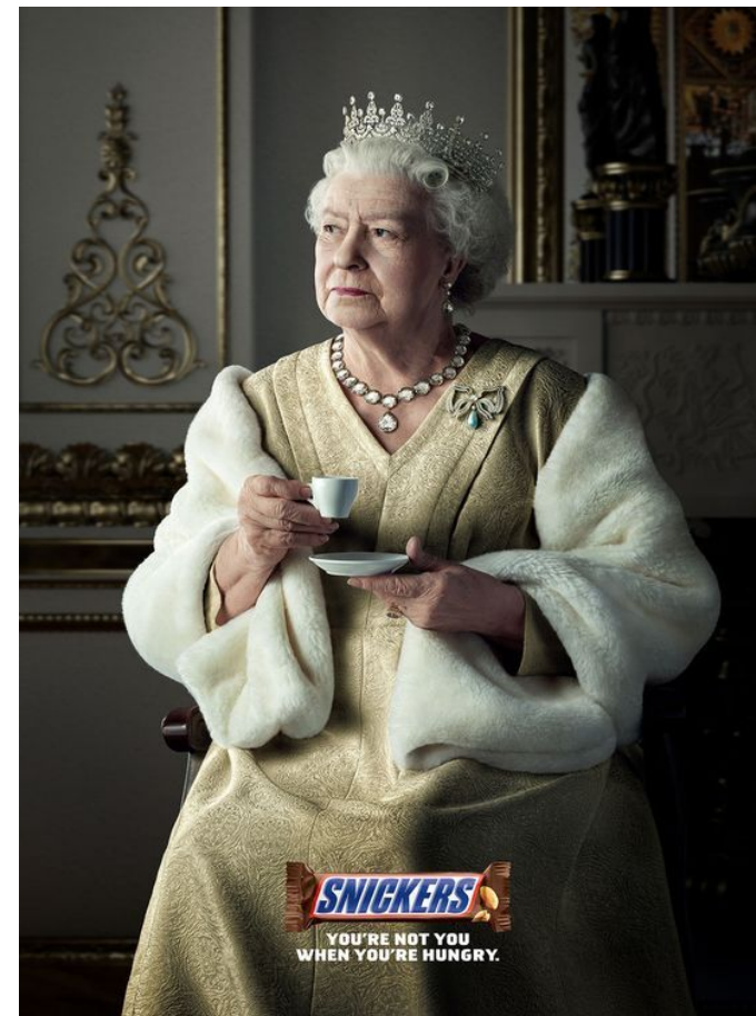
Королева в рекламе сникерс