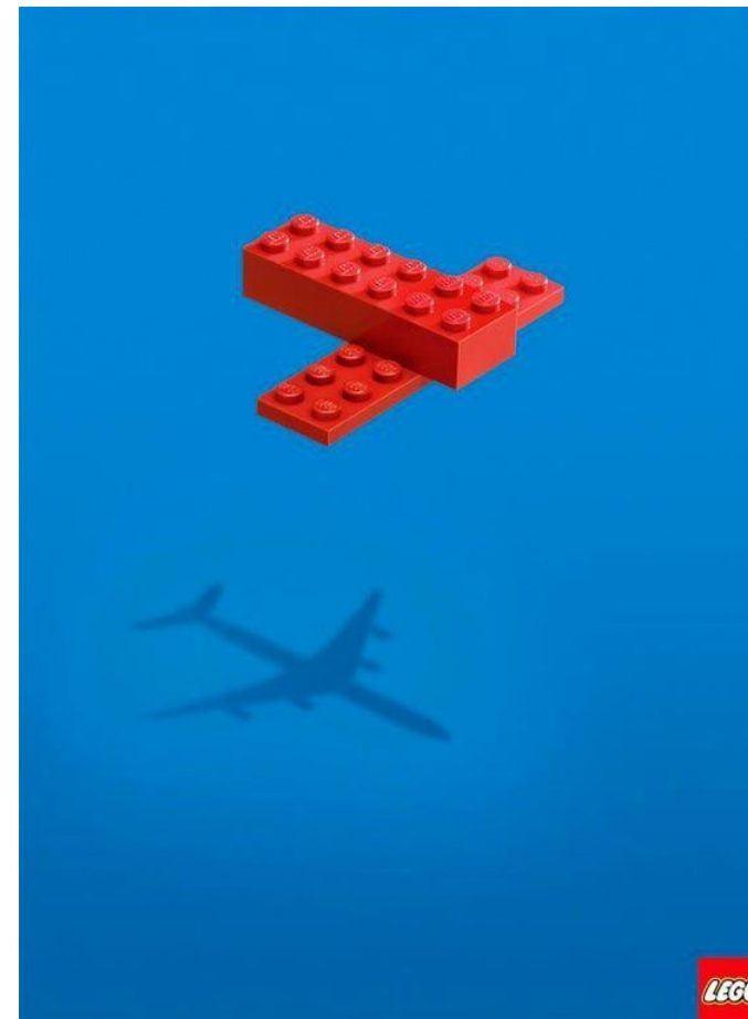
Самолёт в рекламе лего – символ полёта фантазии при игре