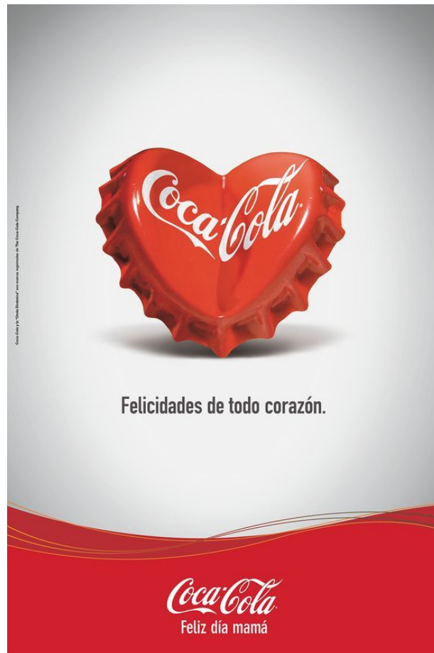
Сердце символ любви