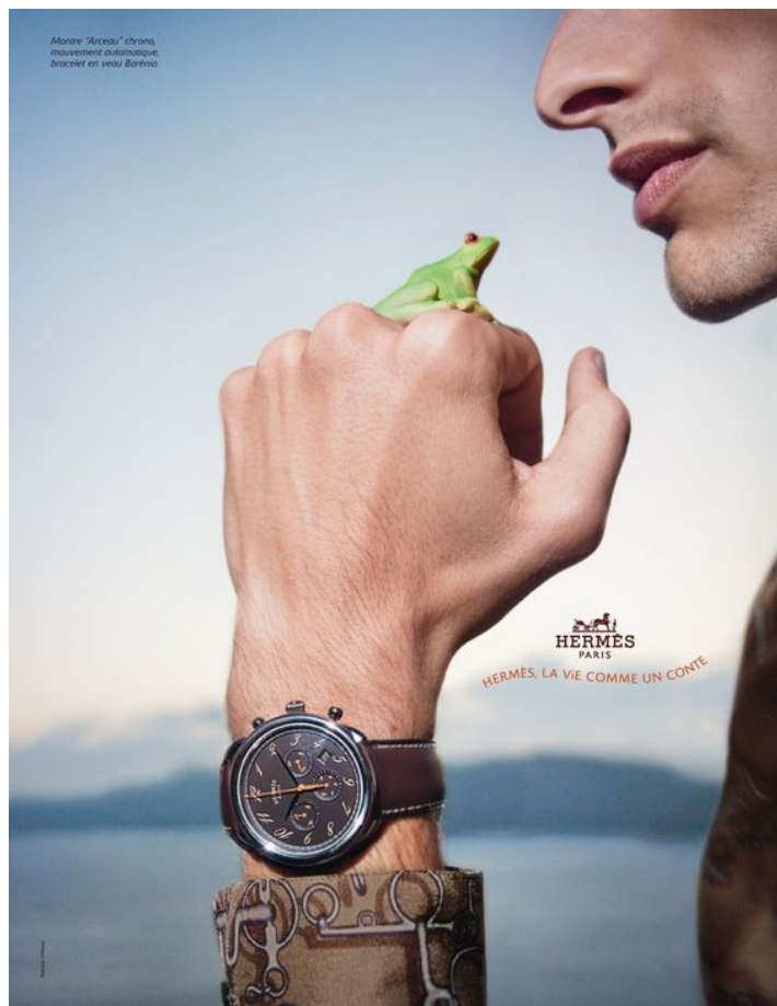
Лягушка как символ принцессы, человек в рекламе – принц