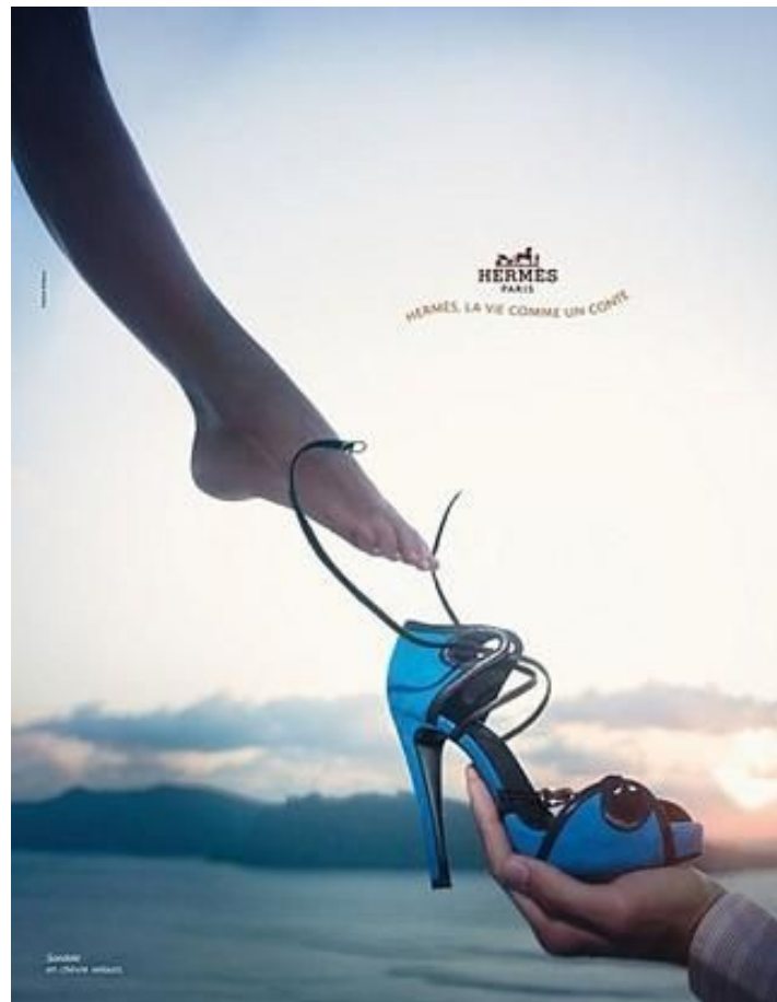
Отсылка к картине «Сотворение Адама»