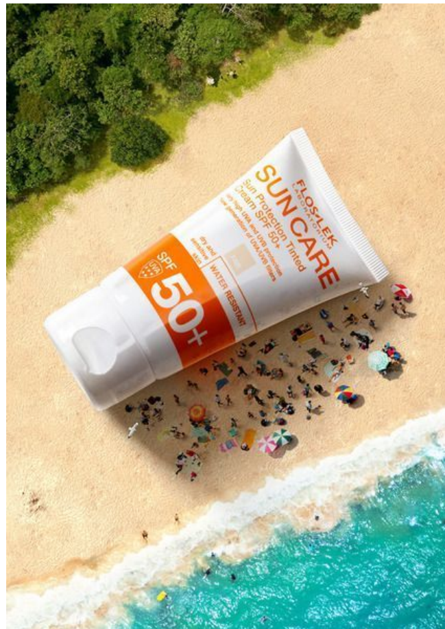
Надёжная защита от солнца