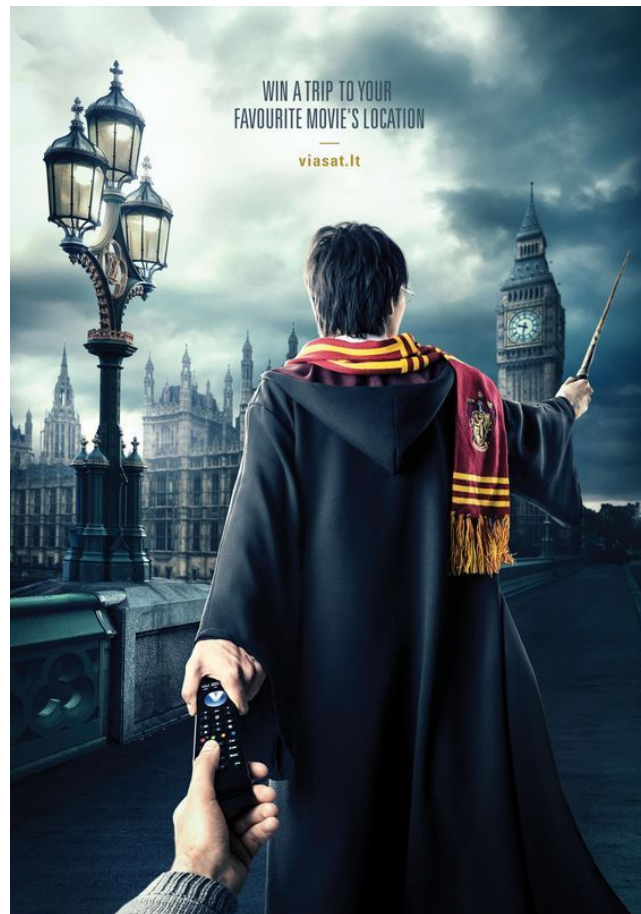
Известные кинофильмы в рекламе цифрового телевидения