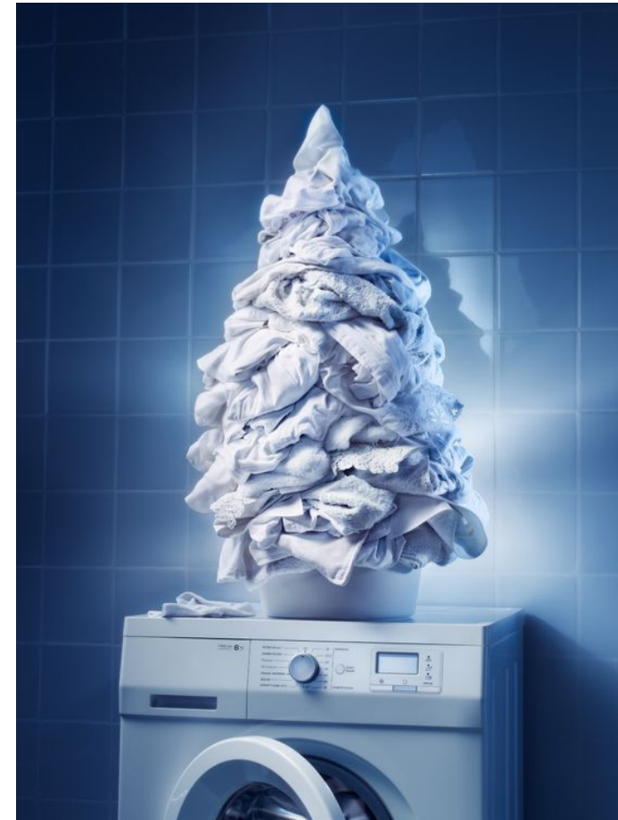
Символ ёлки как нового года в рекламе отбеливающего порошка