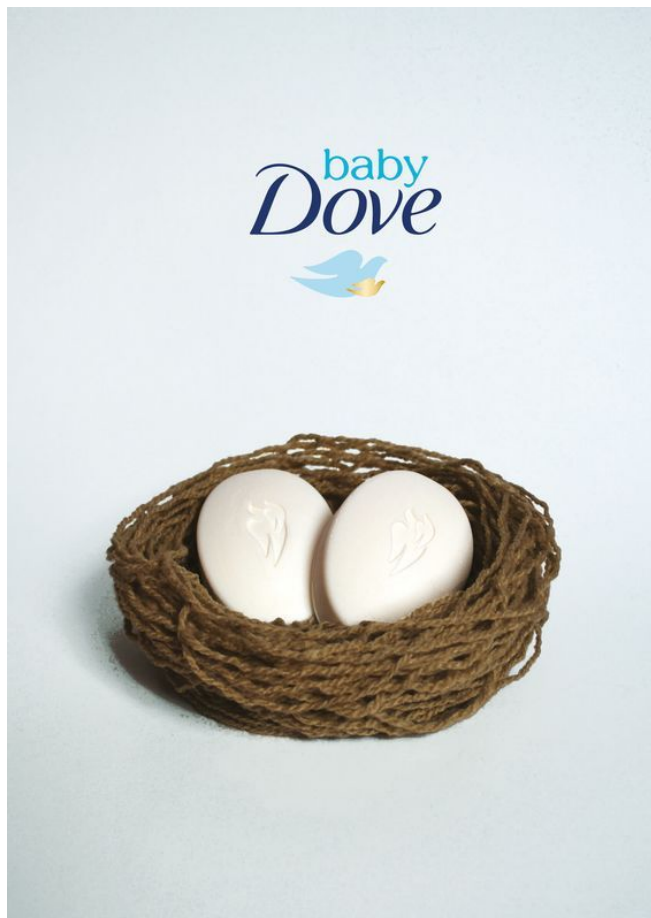
Гнездо как символ семейного очага