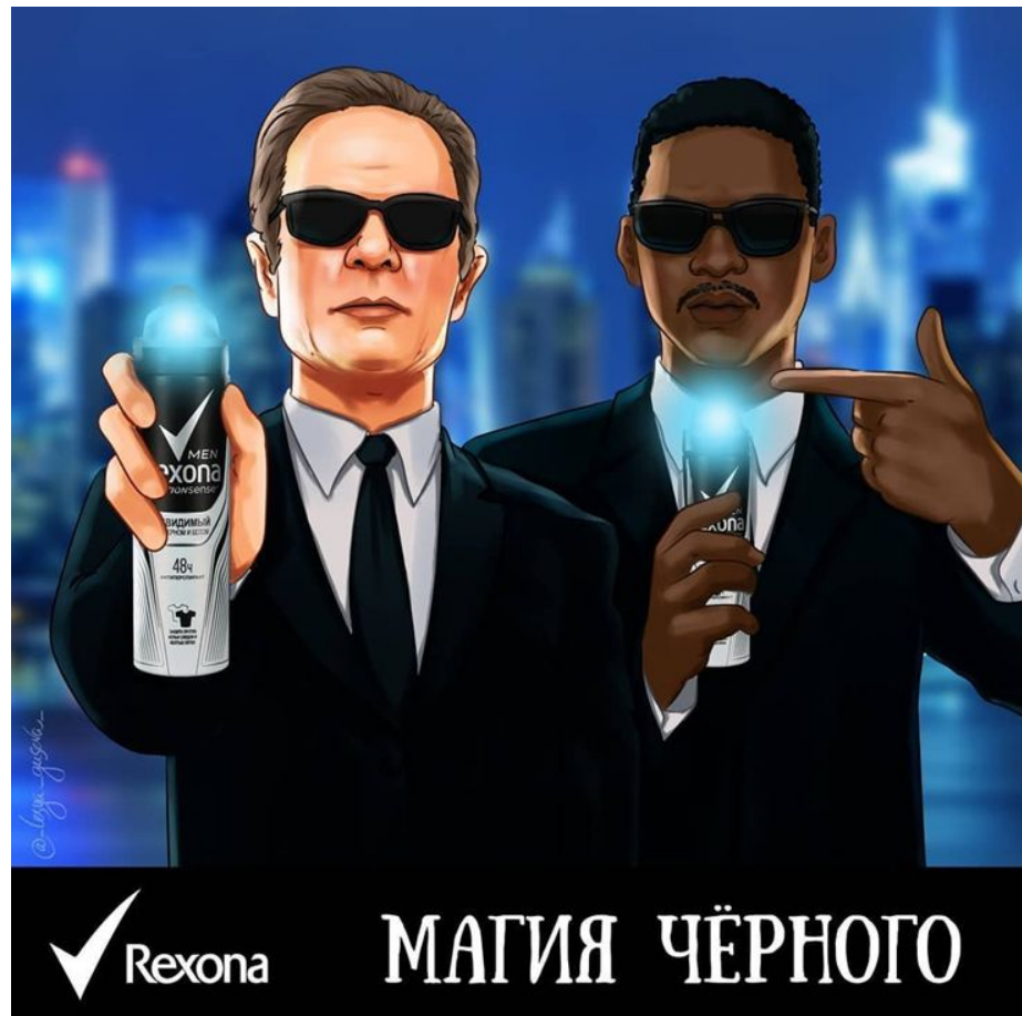
Отсылка к фильму «Люди в чёрном»