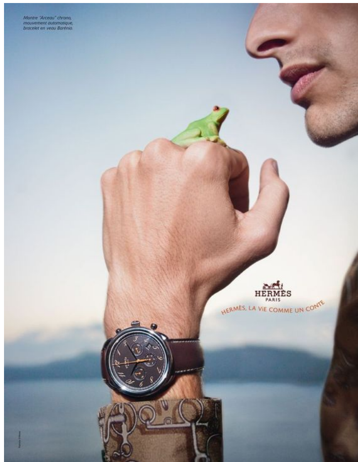
Лягушка как символ принцессы, человек в рекламе – принц