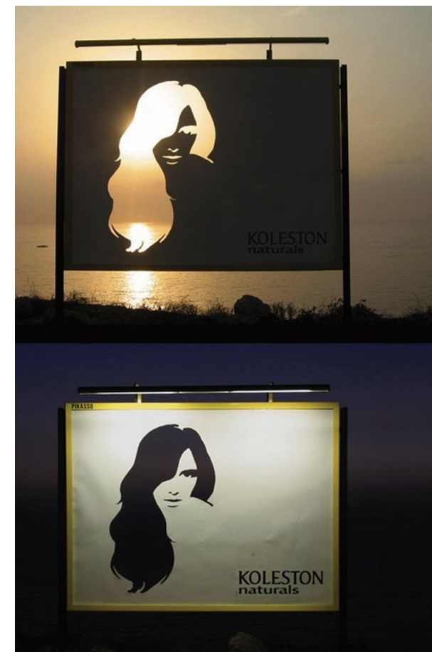
Только натуральные цвета (краска для волос)