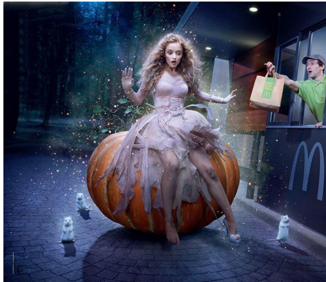
Золушка в рекламе McDonald's