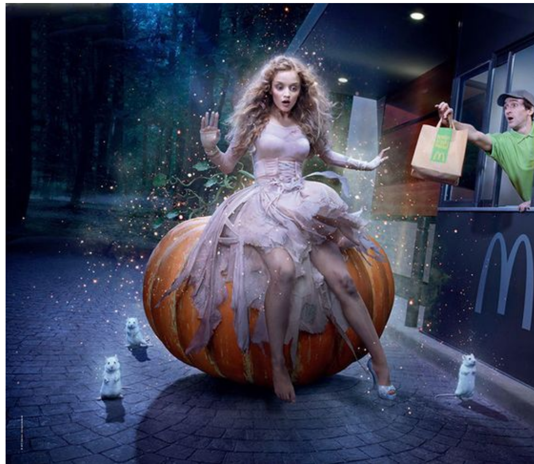
Золушка в рекламе McDonald's