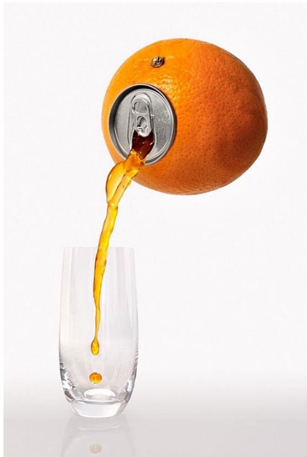
Только из спелых фруктов