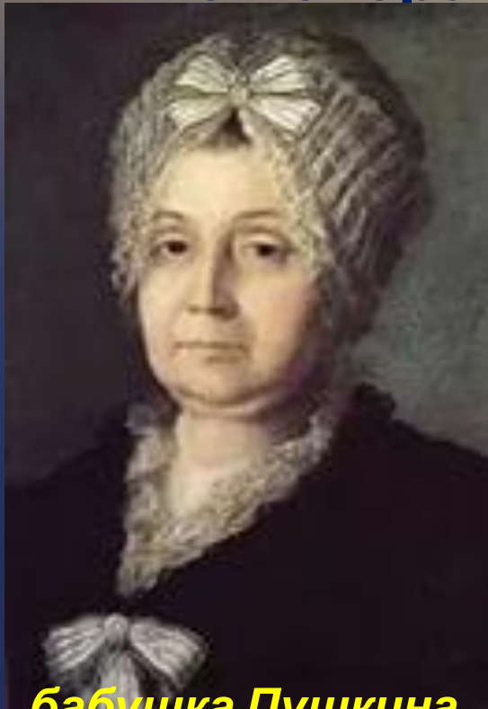
бабушка Пушкина Мария Алексеевна Ганнибал

Летом Пушкина увозили в Захарьино, подмосковную деревню бабушки. Мальчик любил эти места: и березовую рощицу, которая начиналась прямо у ворот захарьинского дома — здесь пили чай в жаркие дни, — и огромную липу у пруда, и темный еловый лес на другом его берегу. Он играл здесь, воображая себя богатырем, сражающимся со злыми силами. А по вечерам он вслушивался в веселые и грустные русские песни и ходил на хороводы, которые водили и мальчики и девушки.