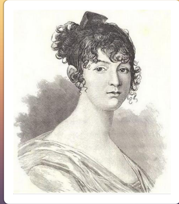
Мать, Надежда Осиповна Пушкина

Родители мало занимались ребенком. Сергей Львович, отец поэта, мало думал о своем хозяйстве, о судьбе крепостных, о доме, о воспитании детей. Он был душой светского общества, любил сострить, блеснуть каламбуром, удивить общество изящным стихом. Надежда Осиповна, мать поэта, была внучкой знаменитого Ганнибала, “арапа Петра Великого”, вывезенного некогда из северной Абиссинии. Красивая светская женщина была занята только собой. Постоянная неуравновешенность ее