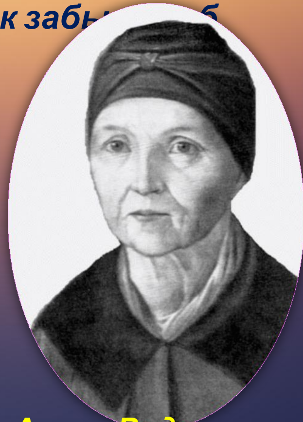
Няня Арина Родионовна

Своим певучим голосом она вводила ребенка в такой ослепительный мир народной фантазии, пела такие удивительные песни, что мальчик забывал об окружающем мире. У отца была превосходная библиотека, преимущественно на французском языке. Ребенок жадно потянулся к книге. Тайно от взрослых он по ночам пробирался к книжным шкафам, читает при свете свечи. Он зачитывается Вольтером. Чтение превратилось в страсть