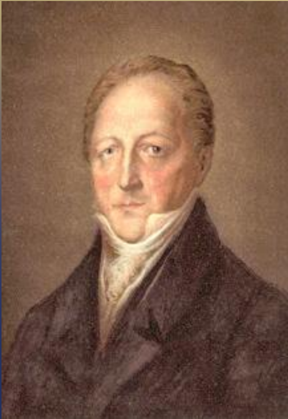
Отец, Сергей Львович Пушкин

Родители мало занимались ребенком. Сергей Львович, отец поэта, мало думал о своем хозяйстве, о судьбе крепостных, о доме, о воспитании детей. Он был душой светского общества, любил сострить, блеснуть каламбуром, удивить общество изящным стихом. Надежда Осиповна, мать поэта, была внучкой знаменитого Ганнибала, “арапа Петра Великого”, вывезенного некогда из северной Абиссинии. Красивая светская женщина была занята только собой. Постоянная неуравновешенность ее