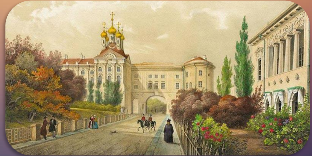
лицей Царское Село

В свободные от уроков часы воспитанники вместе с педагогами спешили в газетную комнату, чтобы узнать свежие новости о движении неприятеля. Всех охватило глубокое патриотическое воодушевление. Оно сблизило лицеистов и одухотворило их