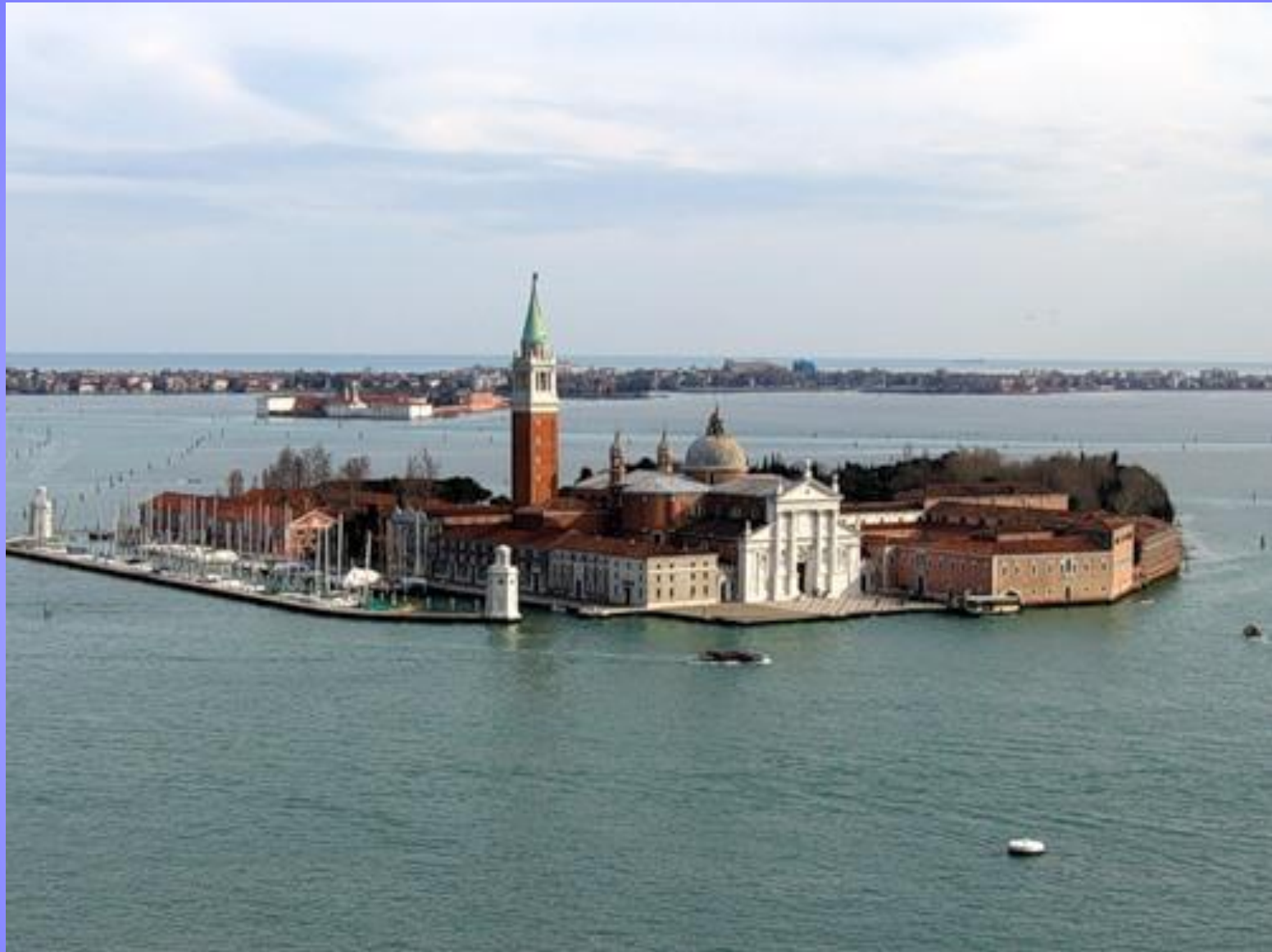
Монастырь Сан-Джорджо Маджоре находится на одноименном острове