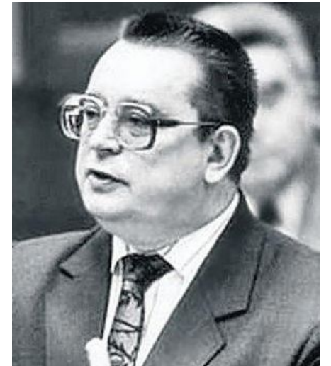
В. Павлов, председатель Совета министров в 1991 году