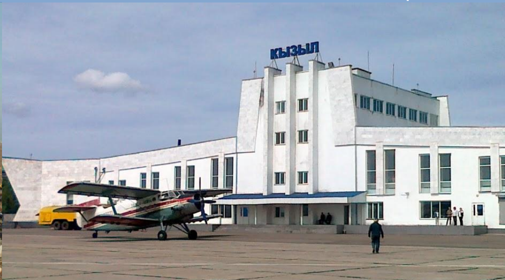
Поставка БРТП «Сэндвич» в аэропорт «КЫЗЫЛ»