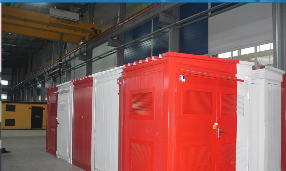
Подстанции КТП в оболочке «Сэндвич»