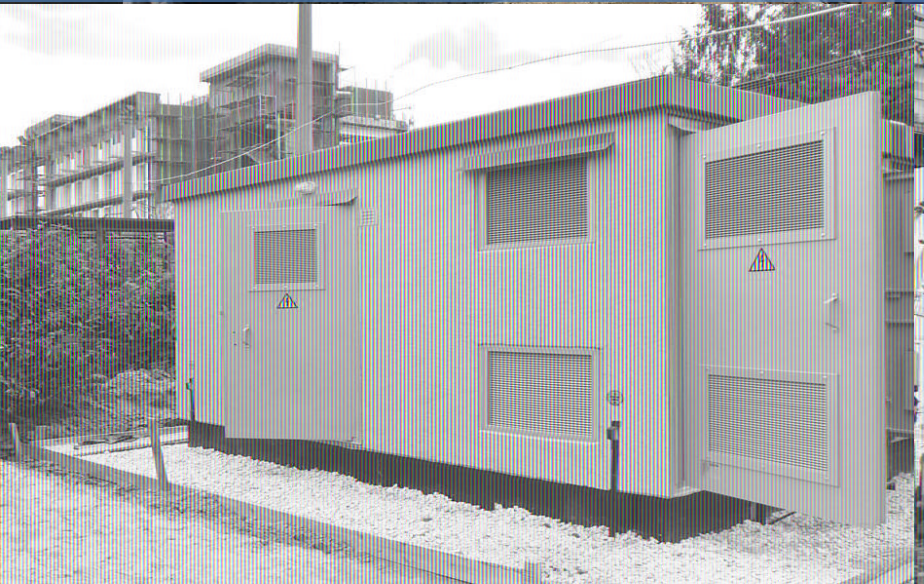
Поставка подстанций для реконструкции Гребного канала в Москве