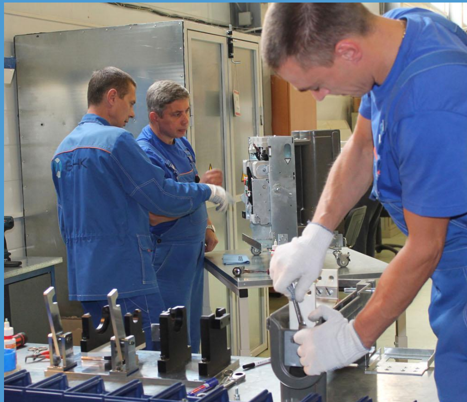
Вакуумные выключатели до 35 кВ