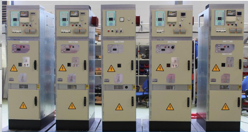
Ячейки КСО-298 М «Московия»