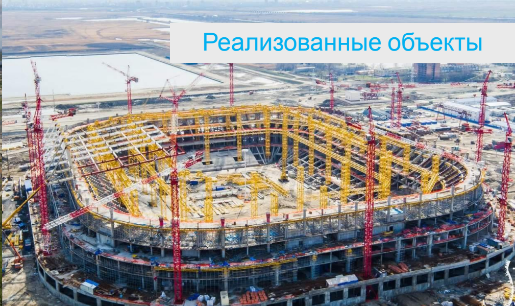
Поставка БРТП, ячеек КРУ М Московия, КРУЭ Московия к ЧМ-2018 «Ростов-Арена»