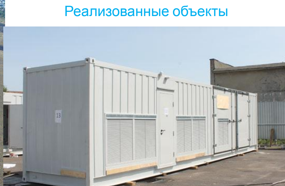
Блочно-модульная инверторная установка (БМИУ)