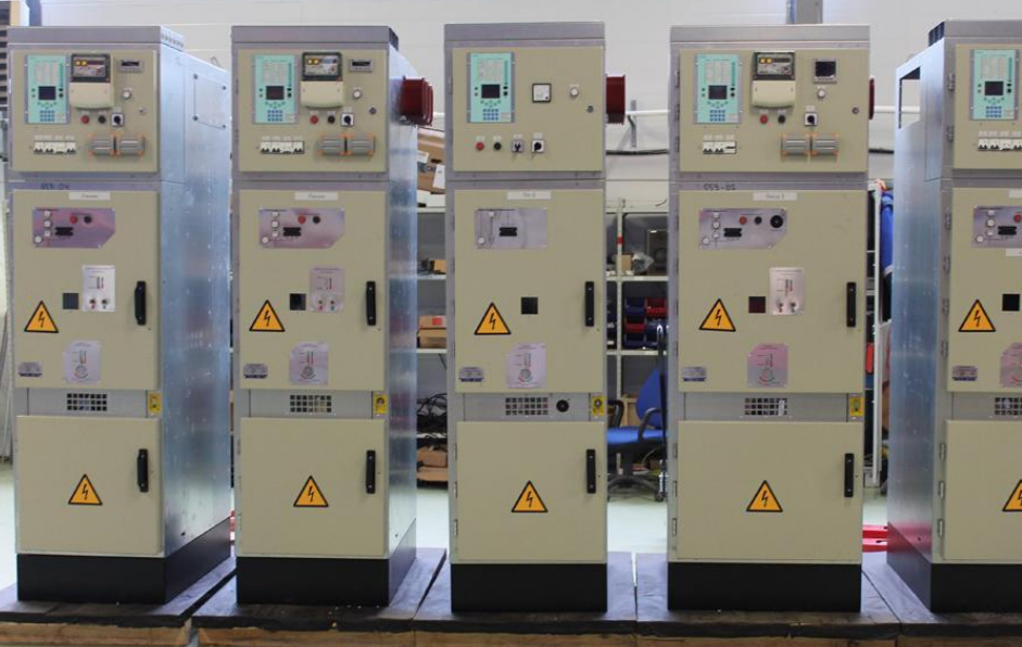
Распределительные устройства 6(10) кВ