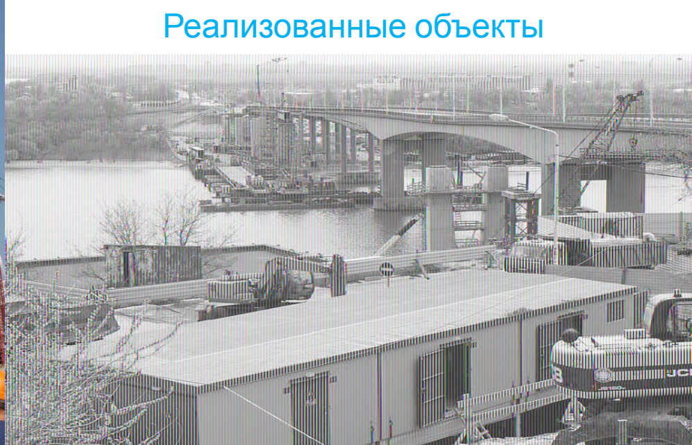
Поставка подстанций для реконструкция Ворошиловского моста в Ростове-на-Дону