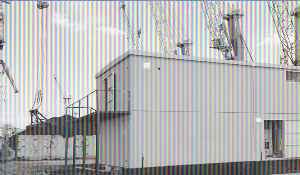
Поставка подстанций для реконструкции Новороссийского морского порта