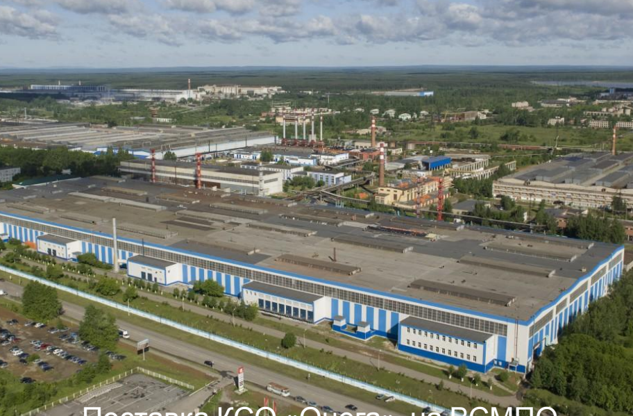
Поставка КСО «Онега» на ВСМПО АВИСМА- крупнейший в мире производитель титана