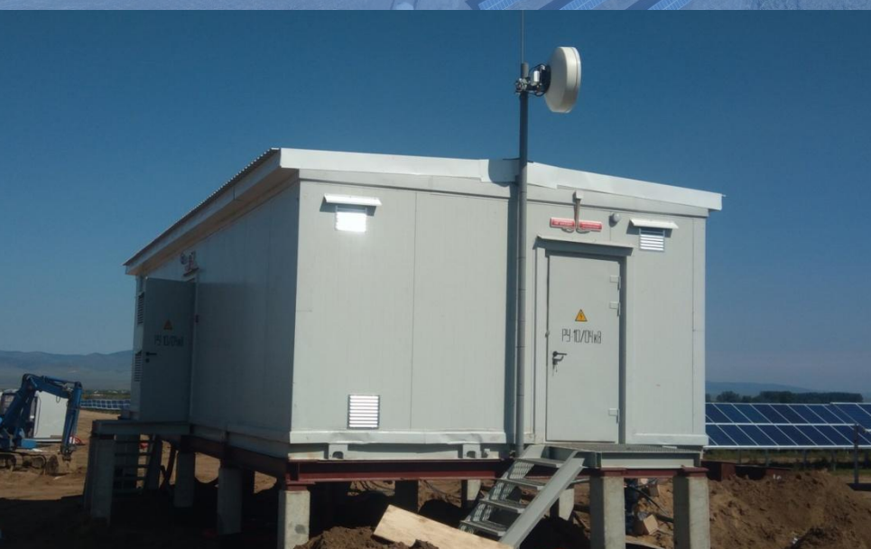
РП для СЭС «Майминская» в Алтайском крае