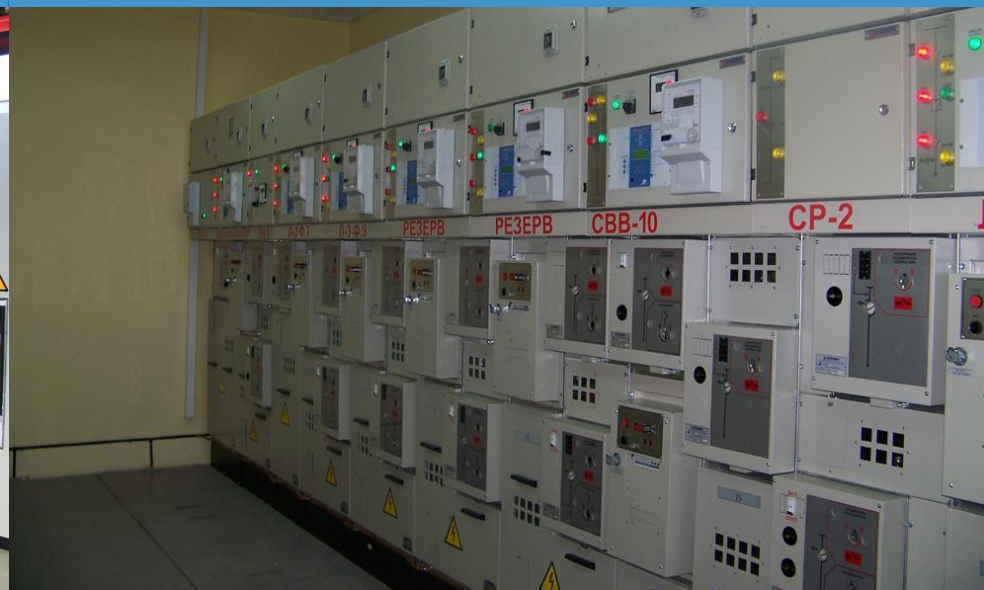
Ячейки КСО-6(10)-Э2 «Онега»