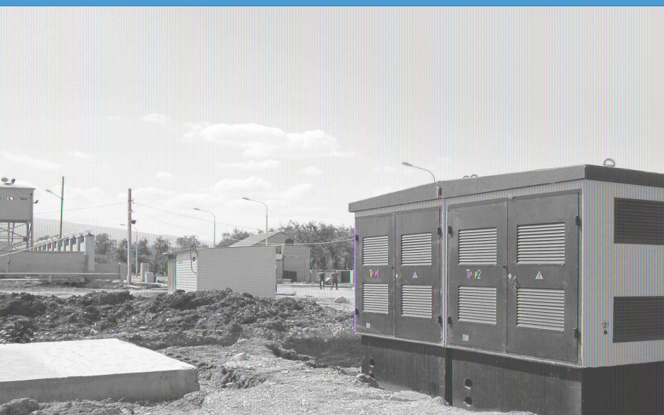
Подстанции КТП в бетонной оболочке