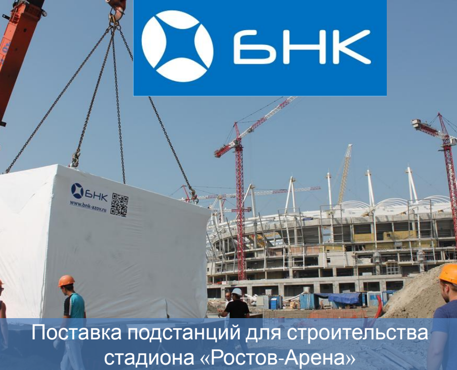
Поставка подстанций для строительства стадиона «Ростов-Арена»