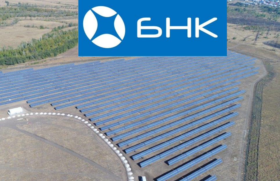
Комплексная поставка РП для СЭС в шесть областей РФ