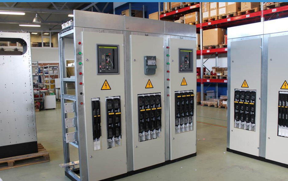
НКУ «Тана» исп. 1.2