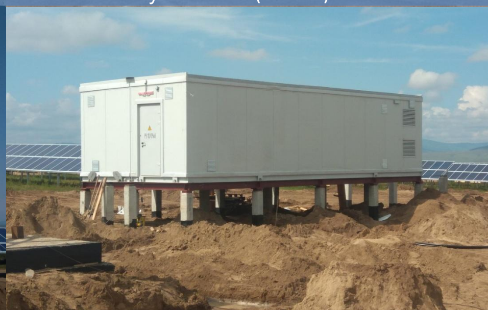
РП для СЭС «Бичурская» в Республике Бурятия