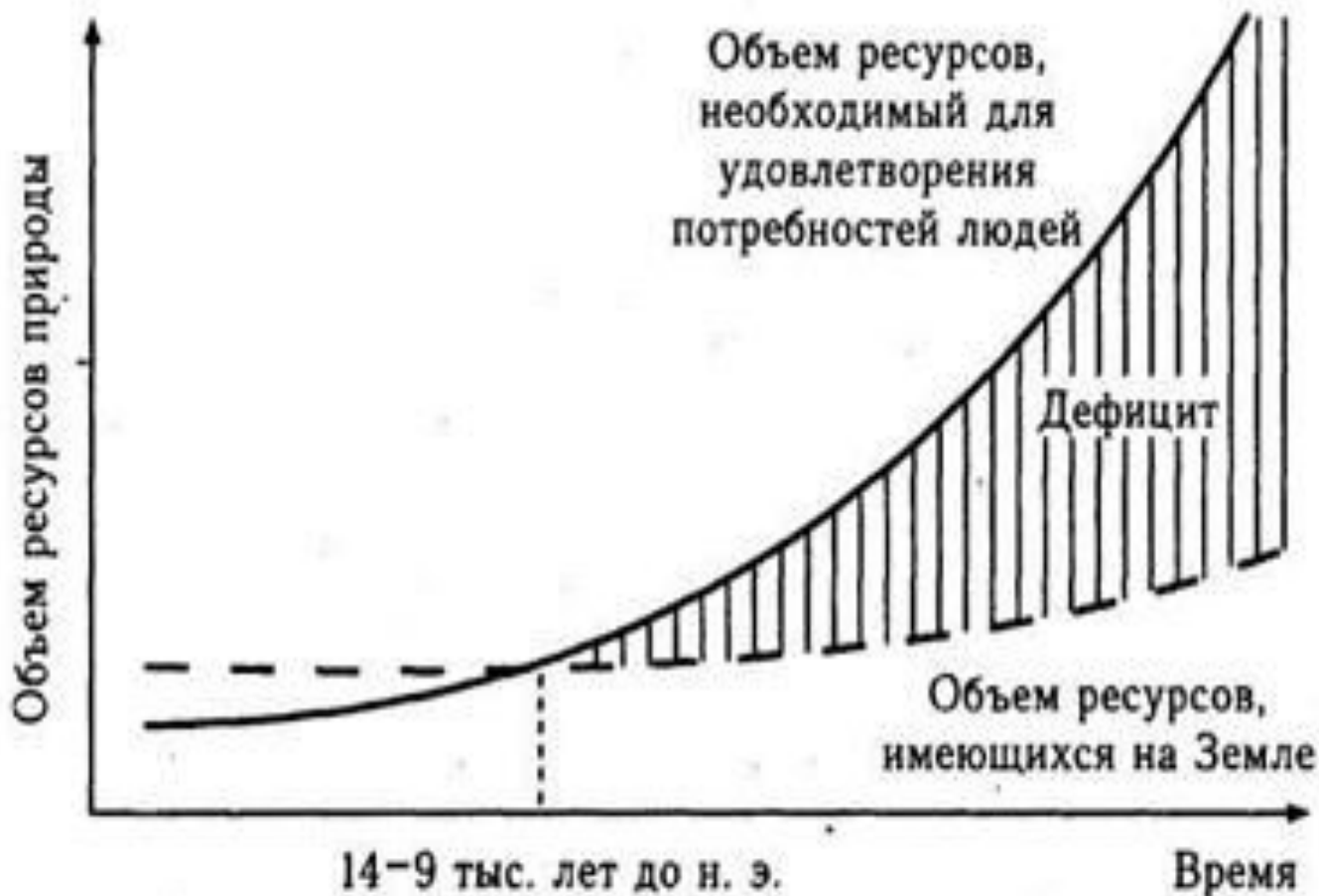
Рис. 1.1. Ограниченность ресурсов