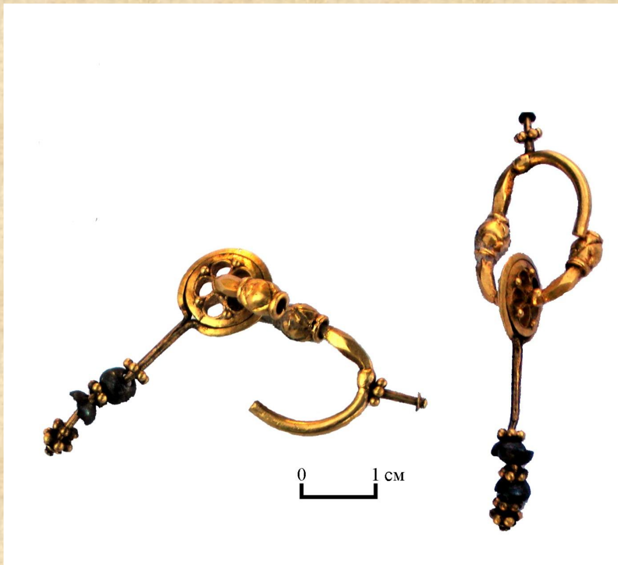
Золотая серьга, найденная в женском погребении на Горькой Балке