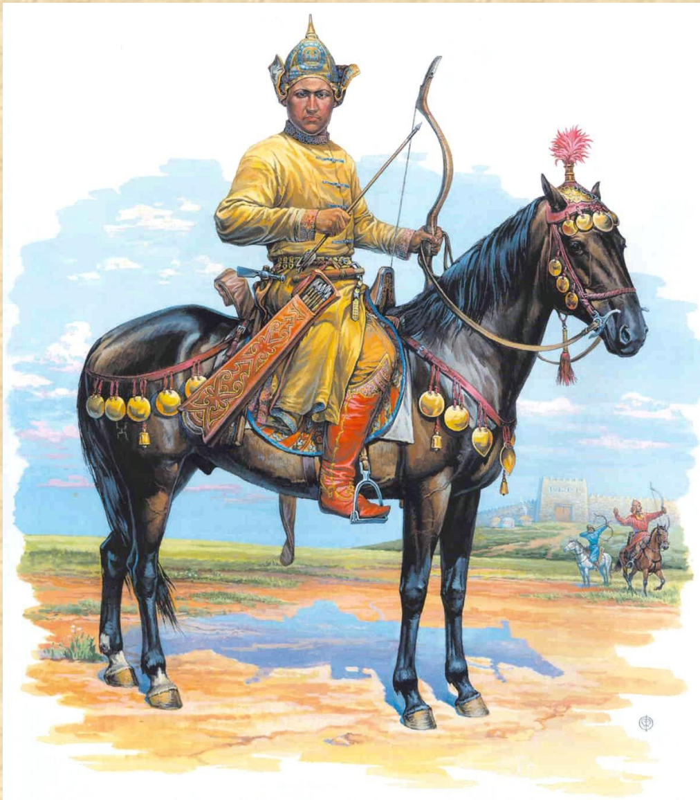
Всадник Хазарского каганата из богатой аланской семьи. Середина IX в.

41,2 % исследованных черепов оказались связаны с «аланским этнокультурным компонентом», 41 % обработанных черепов был связан с «горским этнокомпонентом». Третий, «тюрко-хазарский компонент» представлен черепами с монголоидной примесью, фиксируемой, в основном на женских черепах.