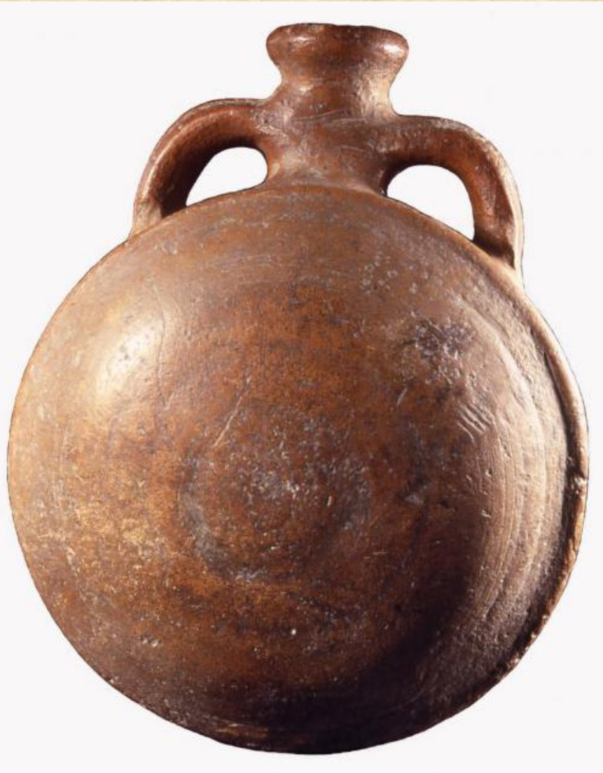
Красноглиняная фляга хазарского времени

В прикубанской степи, где кочевали болгары и аланы, вдоль правого берега реки, шла цепь небольших хазарских укрепленных поселений - пограничных военных и торговых форпостов.