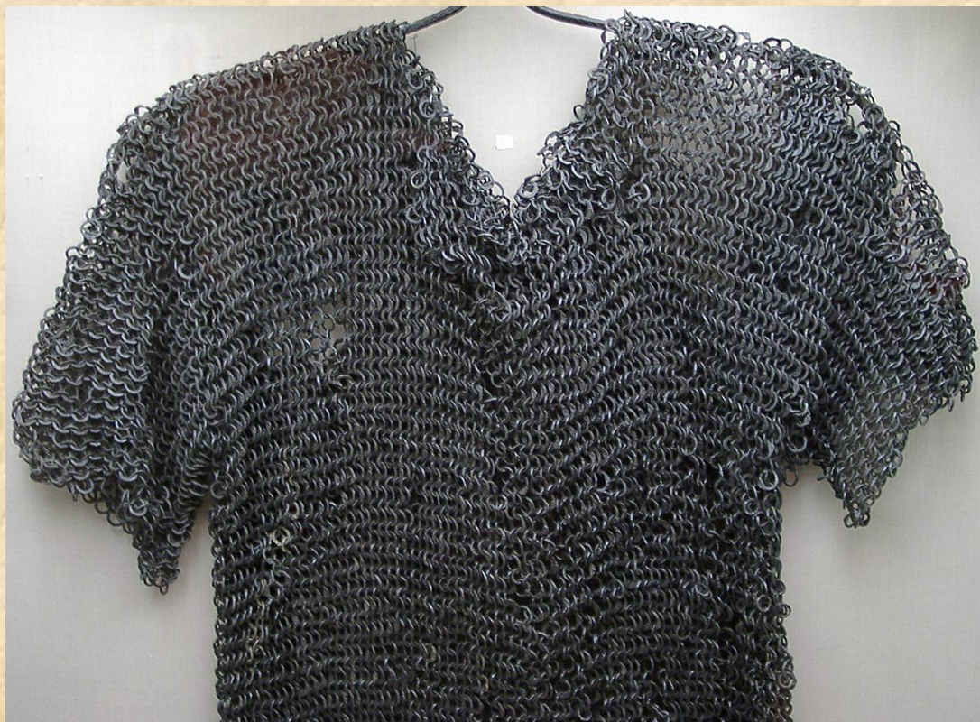
Шлем и кольчуга из «погребения №106» болгаро-хазарского времени из Казазово. VII-IX века