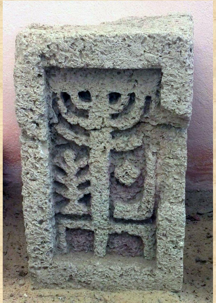
Иудейские надгробия из поселка Сенного и станицы Тамань