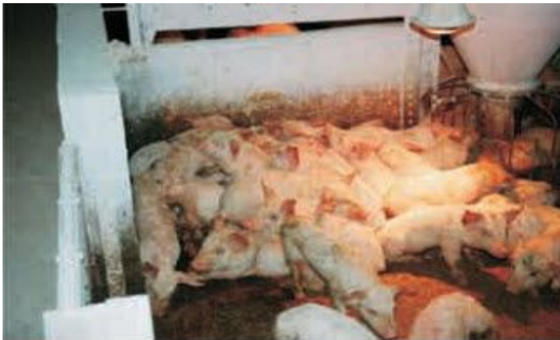
Рисунок 1. Поросята, больные ЦВИС