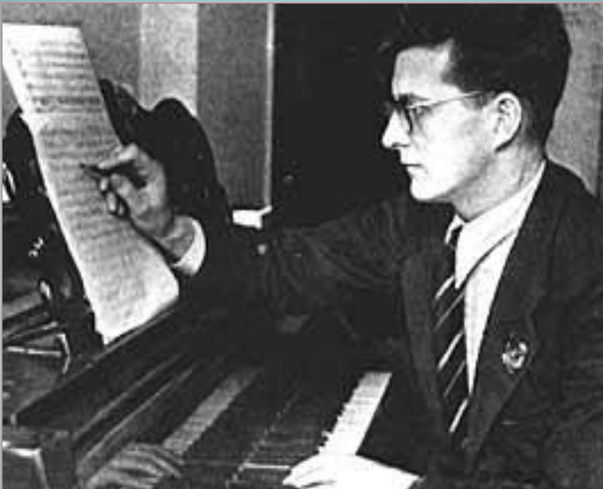
Дмитрий Дмитриевич Шостакович