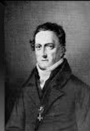
Герbart, Иоганн Фридрих (1776-1841)

* Единственно научной психологией Потебня считает психологию Гербарта. Лингвистику Потебня основывает на теории представлений Гербарта, рассматривая образование каждого слова как процесс апперцепции, суждения, т. е. объяснения вновь познаваемого через прежде познанное.