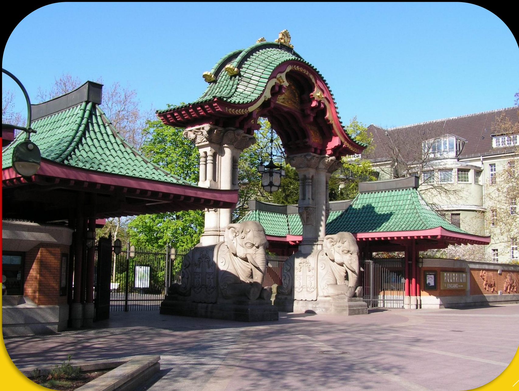
DER BERLINER ZOO