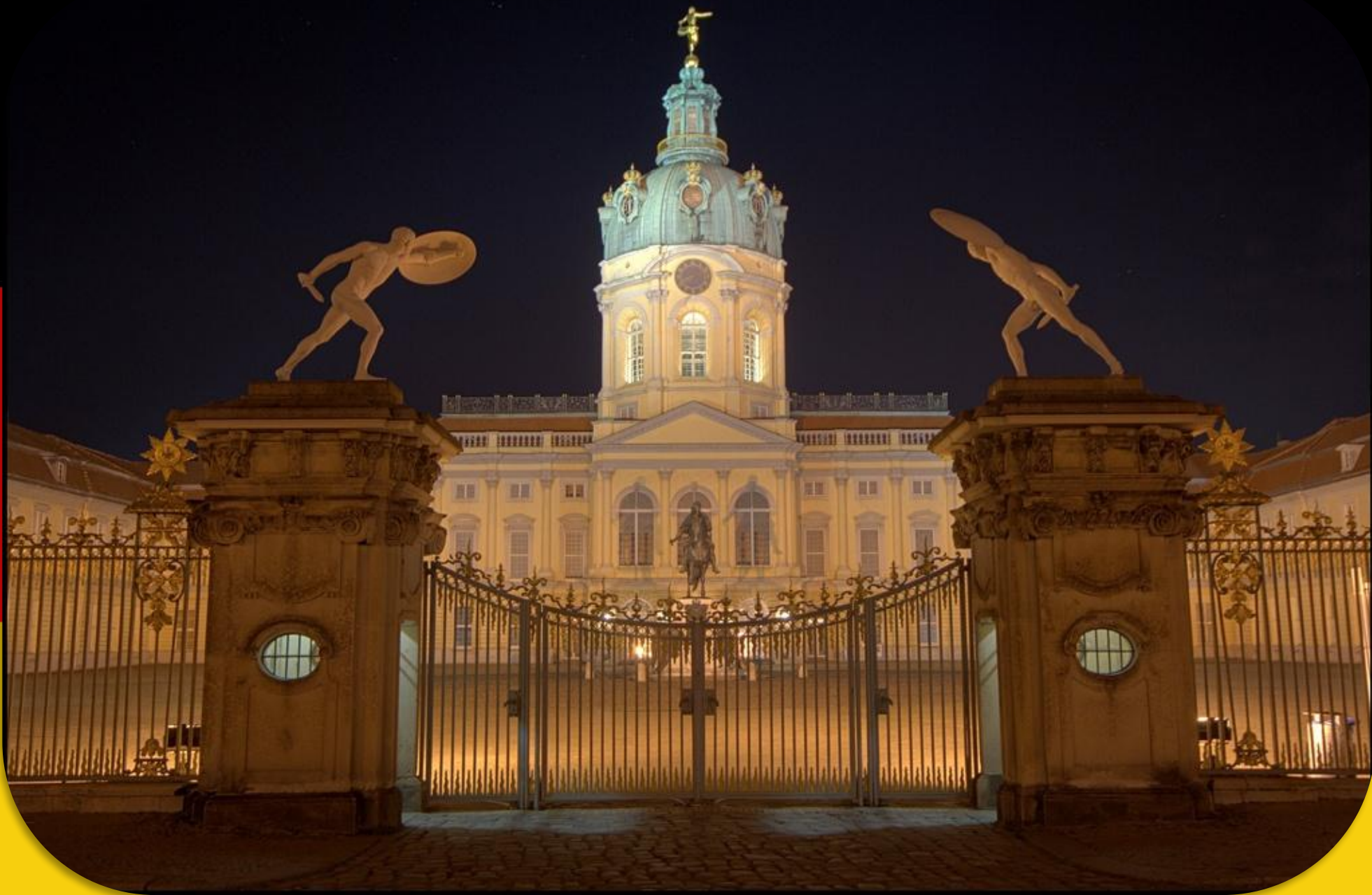
DAS SCHLOSS CHARLOTTENBURG