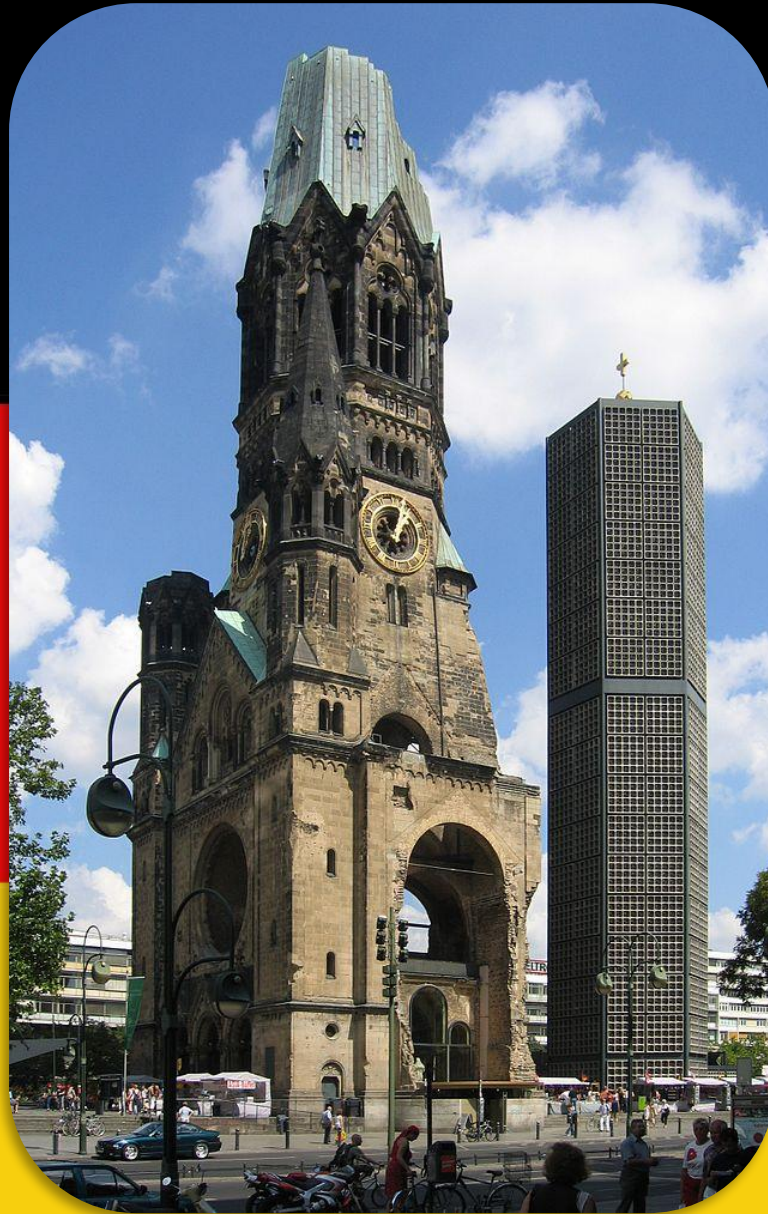
KAISER WILHELM GEDÄCHTNISKIRCHE