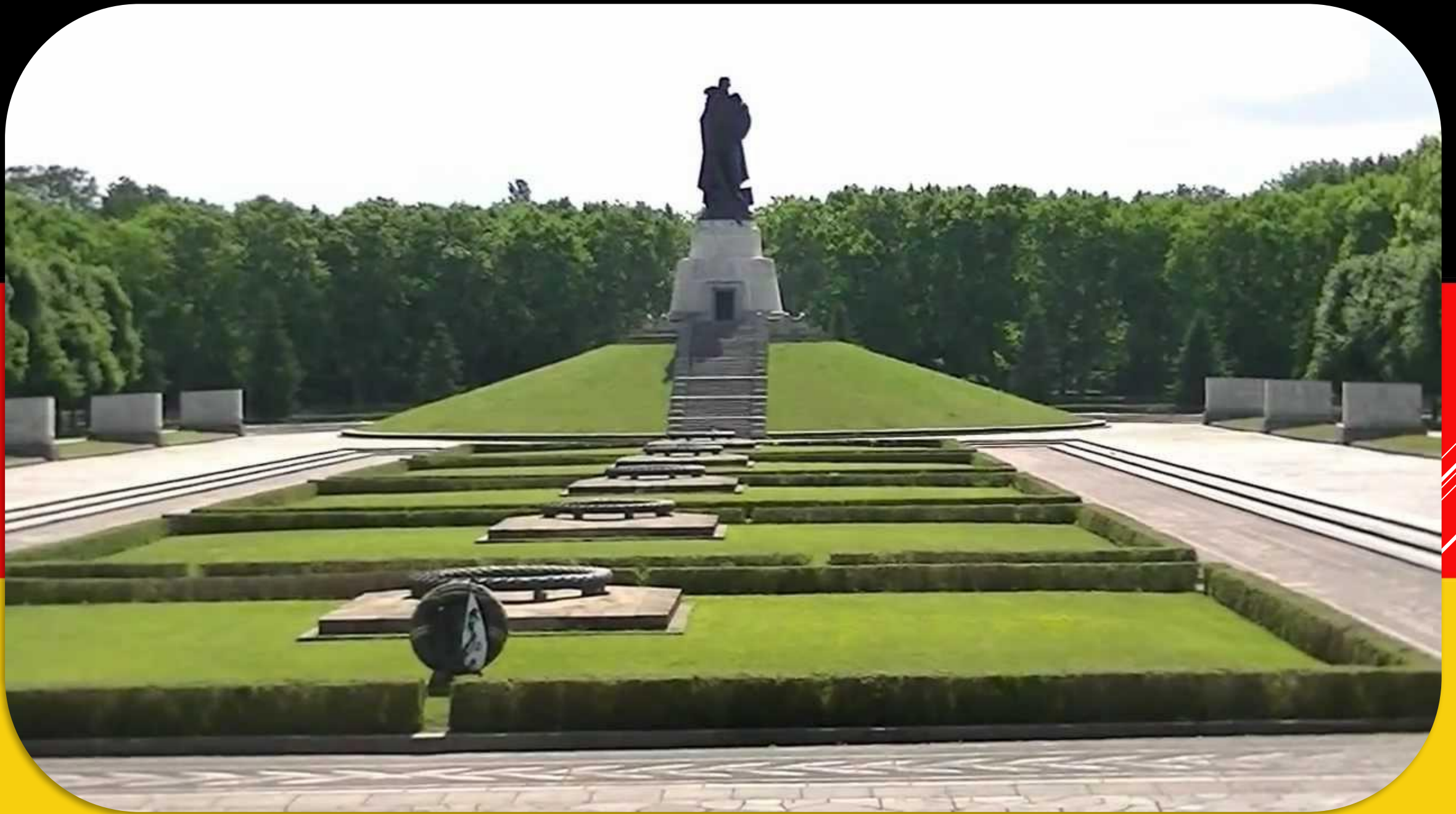
DER TREPTOWER PARK