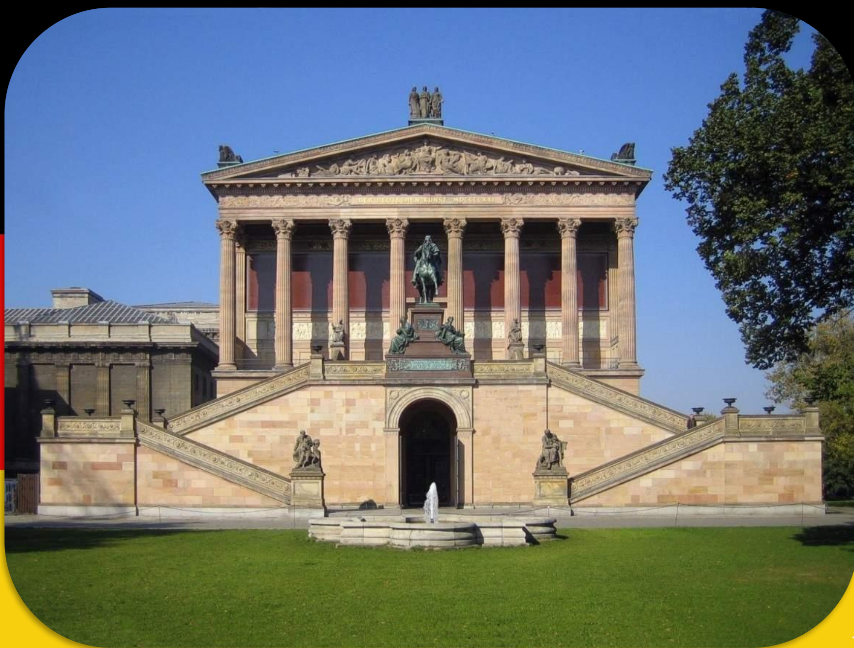
DIE ALTE NATIONALGALERIE