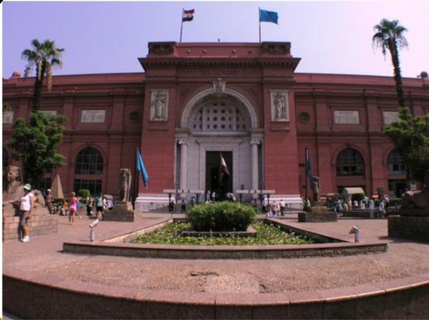
DAS ÄGYPTISCHE MUSEUM