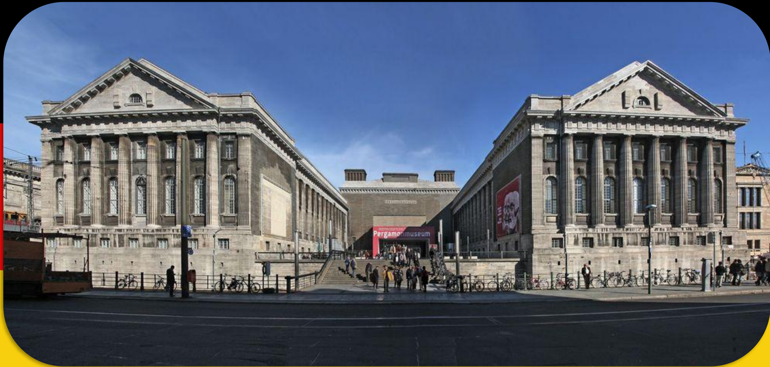
DAS PERGAMON MUSEUM