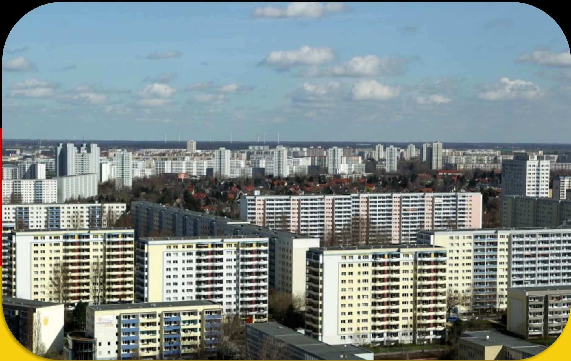
MARZAHN (SOWJETISCHE BEZIRK)