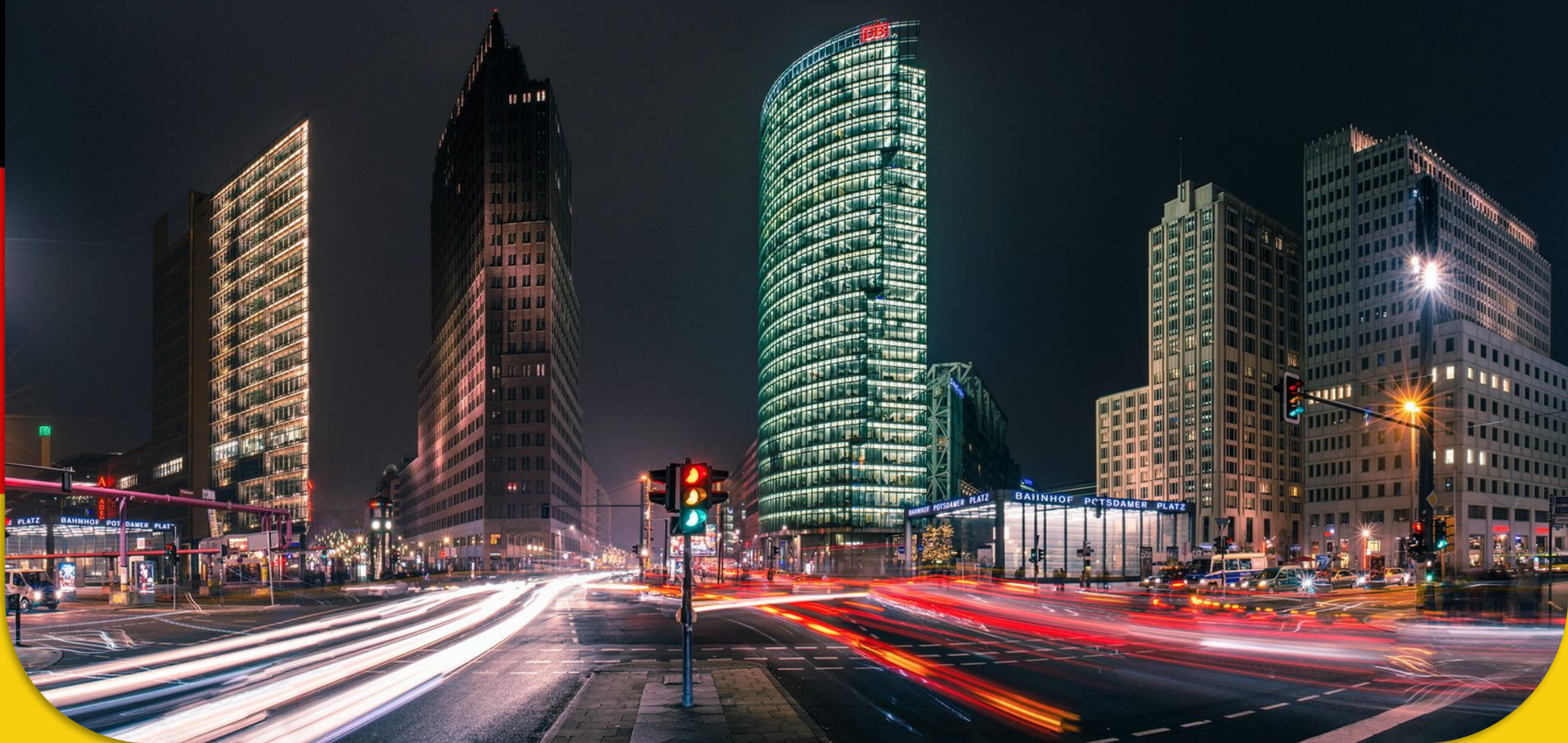
DER POTSDAMER PLATZ