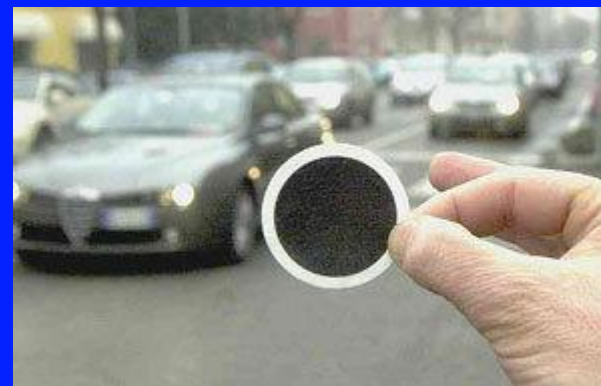
Фильтр после продувки у оживленной трассы