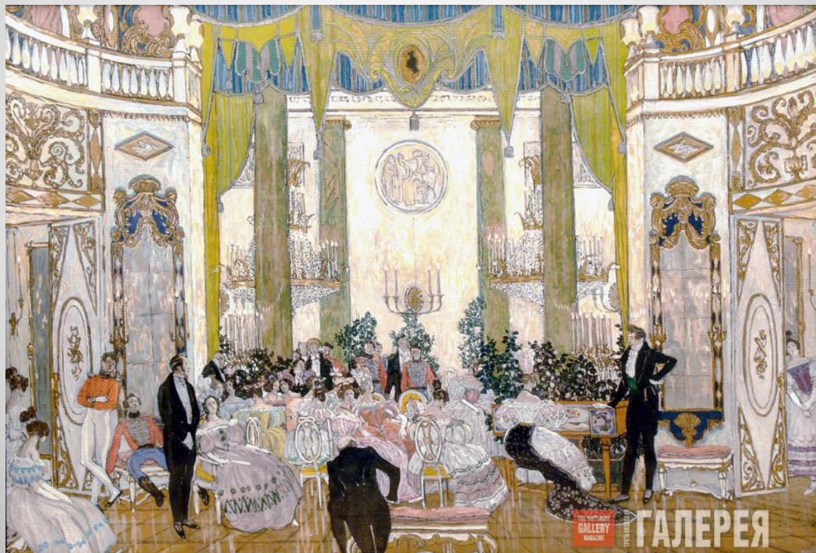
А.Я.Головин. Бал баронессы Штраль. Эскиз декорации к спектаклю по драме М.Ю. Лермонтова «Маскарад», реж В.Э Мейерхольд, Александринский театр, СПб, 1917г

Художник-сценограф должен в совершенстве владеть искусством рисунка, живописи, композиции, ему необходимы навыки дизайнера, архитектора, технолога, конструктора. Он должен хорошо знать устройство сцены.