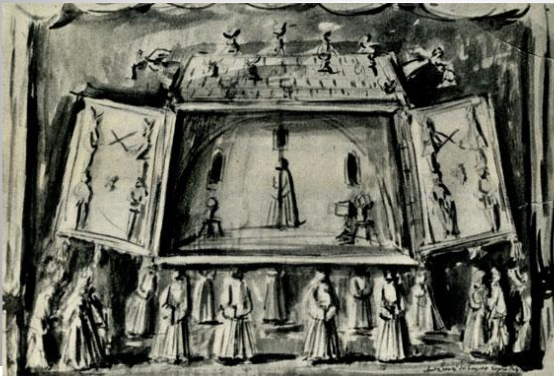
А. Тышлер. 'Король Лир'. Эскиз декорации. 1934