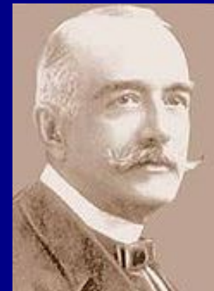
Сергей Андреевич Муромцев