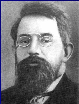
Пётр Бернгар- дович Струве