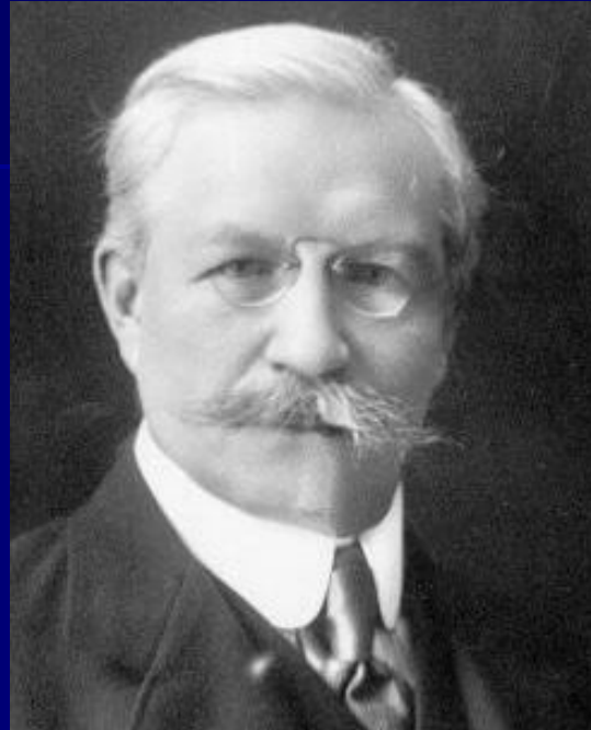
Павел Николаевич Милюков , председатель