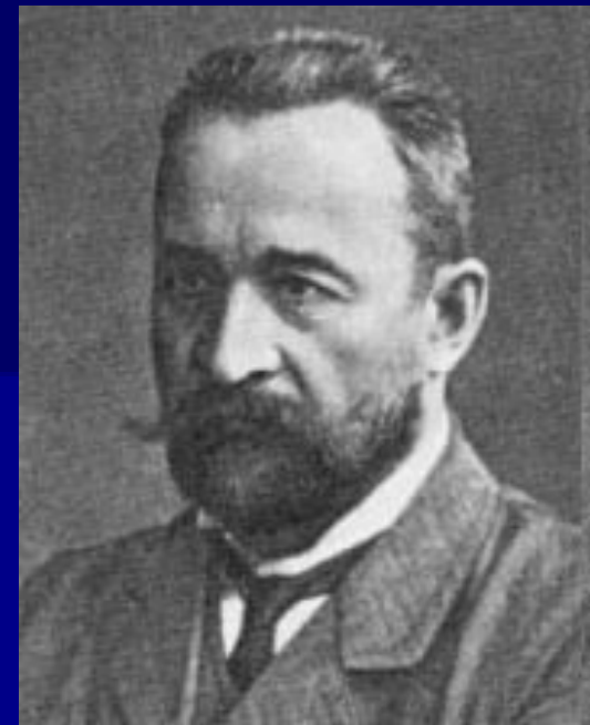
Князь Георгий Евгеньевич Львов