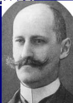
Фёдор Александ- рович Головин