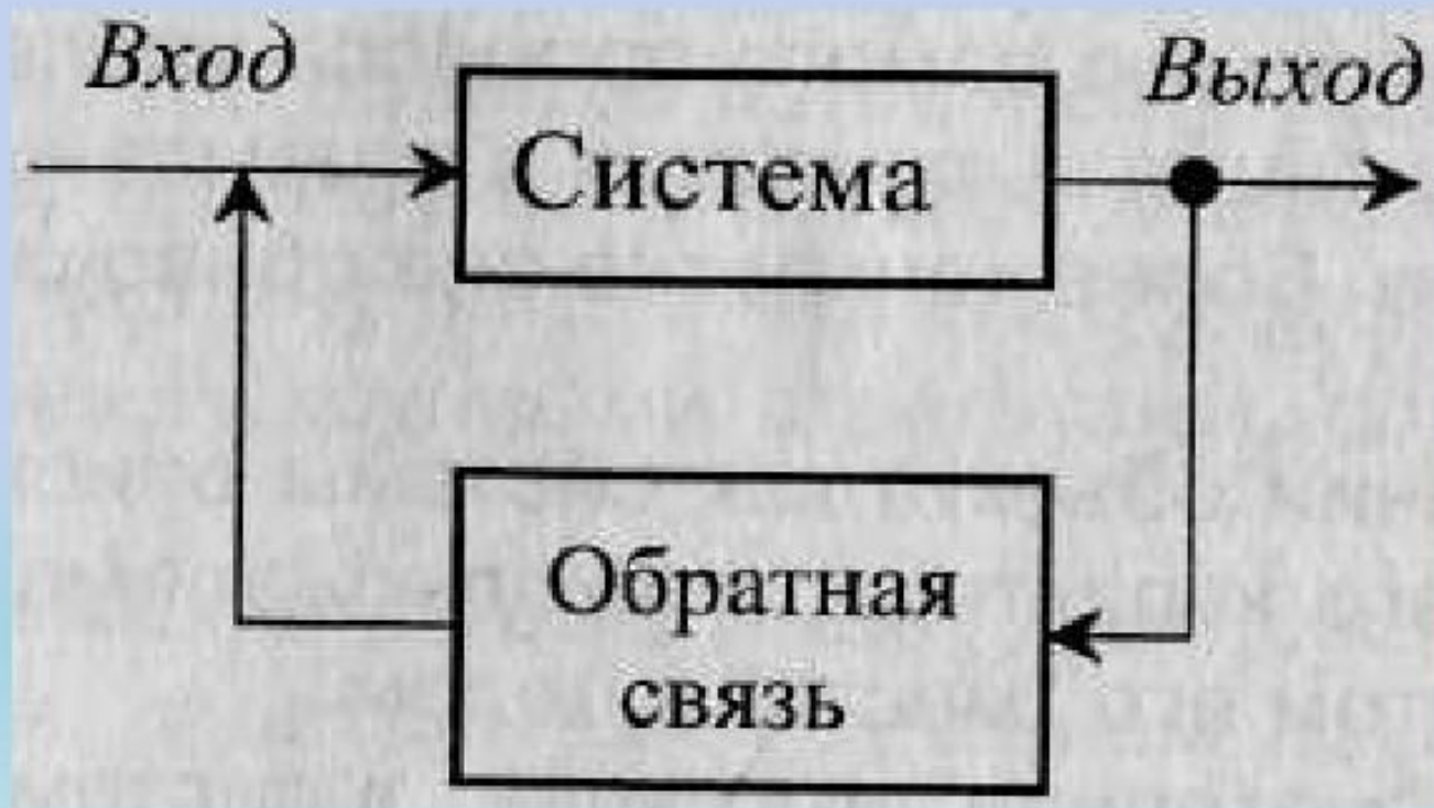
Рис. 1.1. Система с обратной связью