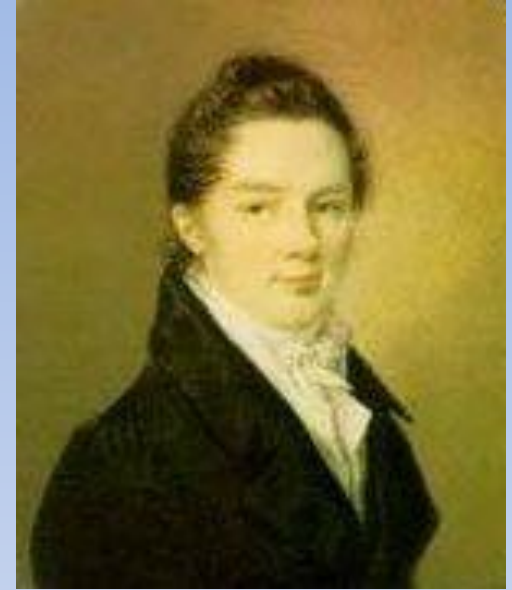
Иван Иванович Пуцин

Пушкин сохранил лицейскую дружбу и культ Лицея на всю жизнь.