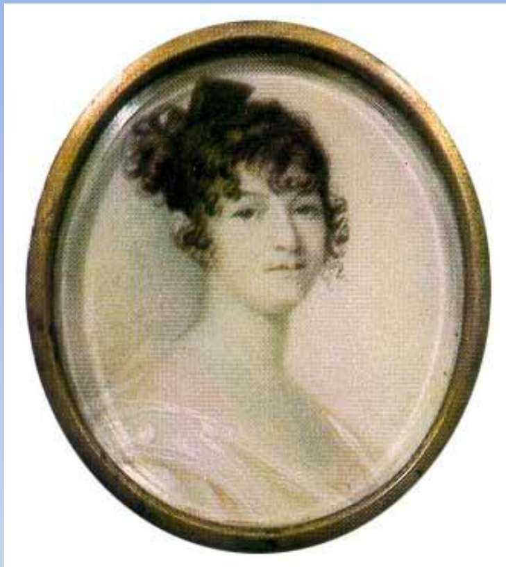
Н.О. Пушкина. 1800-е гг.

Мать, Надежда Осиповна , приходилась внучкой арану Петра I, впоследствии русскому генералу Ганнибалу.