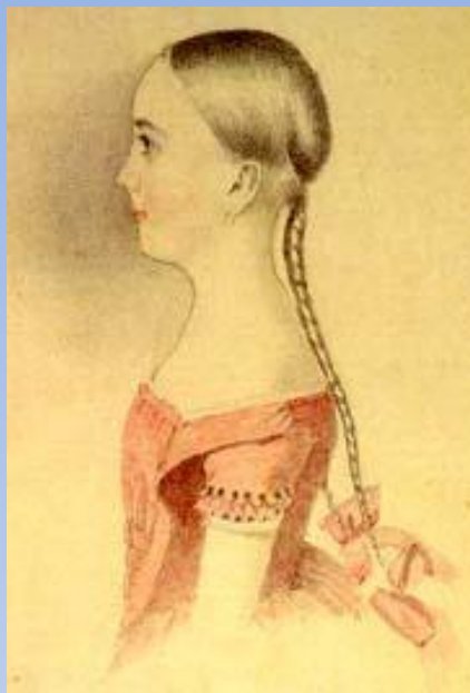
Старшая дочь Мария Александровна Пушкина (1832-1919г.)