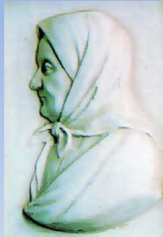
Яковлева Арина Родионовна

Любовь к родному языку маленькому Пушкину привили бабушка, Мария Алексеевна Ганнибал, превосходно говорившая и писавшая по-русски, и няня Арина Родионовна.