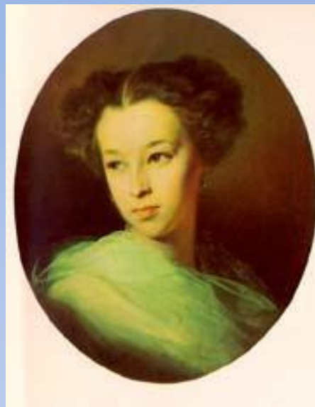
Младшая дочь Наталья Александровна Пушкина (1836-1913г.)

У А.С.Пушкина и Натальи Гончаровой было четверо детей.