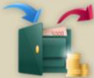
Исполнение федерального бюджета

Этап IV Отчетность 1 апреля 2017 — 31 декабря 2017