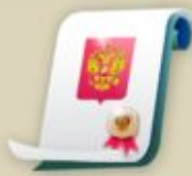
Подготовка документов для исполнения федерального бюджета

Этап III Исполнение федерального бюджета 1 января 2016 — 31 декабря 2016