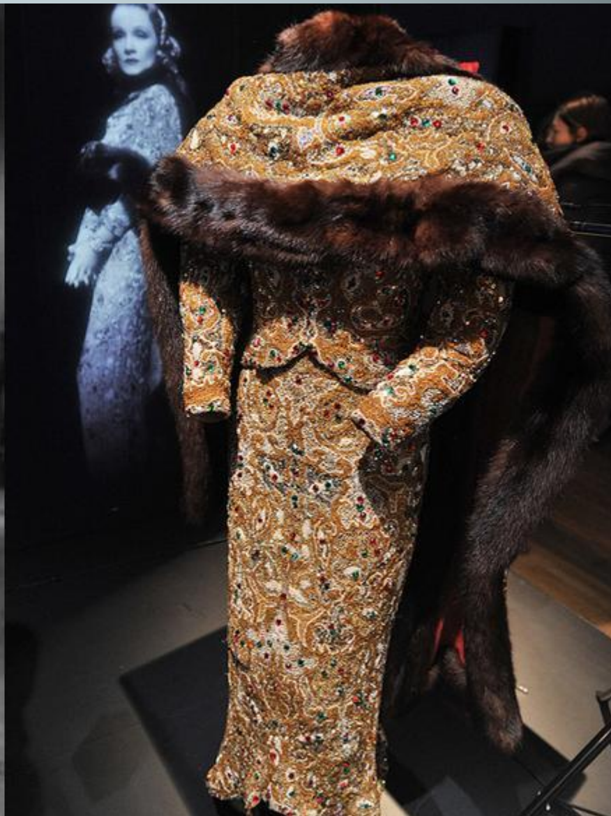
Платье Марлен Дитрих из фильма «Ангел» 1937 г., художник по костюмам Тревис Бентон. Парижский Музей моды