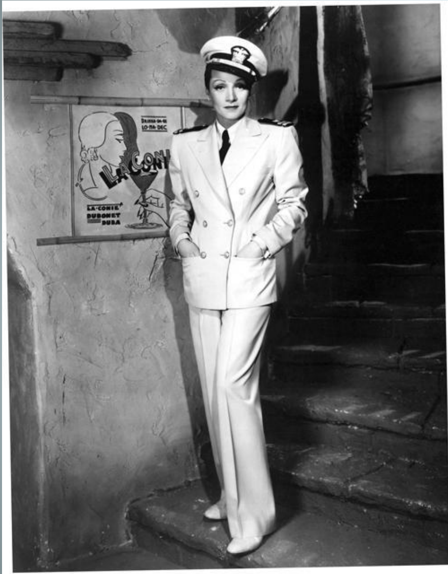
М. Дитрих к/ф «Семь грешников», 1940