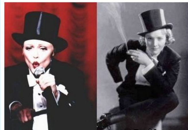
Слева: Марлен Дитрих, 1960-е г. Справа: Мэрилин Монро, 1960-е г.