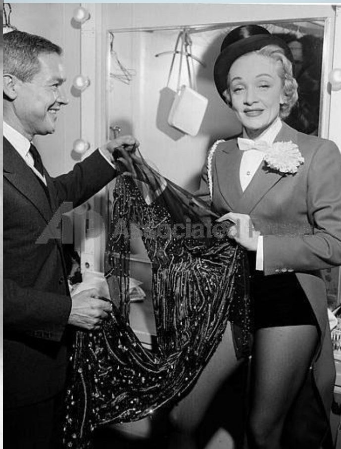
Жан-Луи и М. Дитрих. Ок 1960