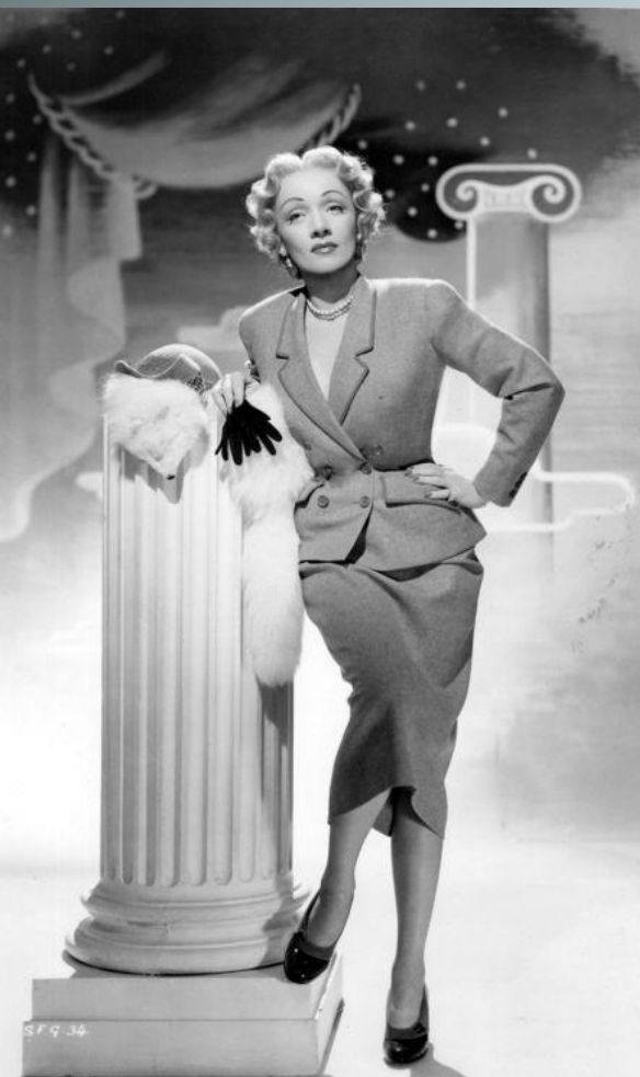
М. Дитрих в костюме от К. Диора. 1950 г.