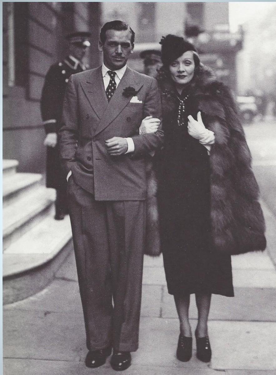
Дуглас Фэрбенкс-младший и Марлен Дитрих 1935 г.