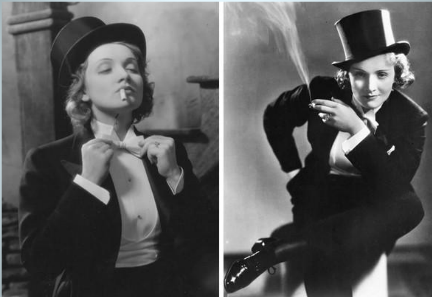
Образ М. Дитрих в к/ф «Марокко» 1931 г.