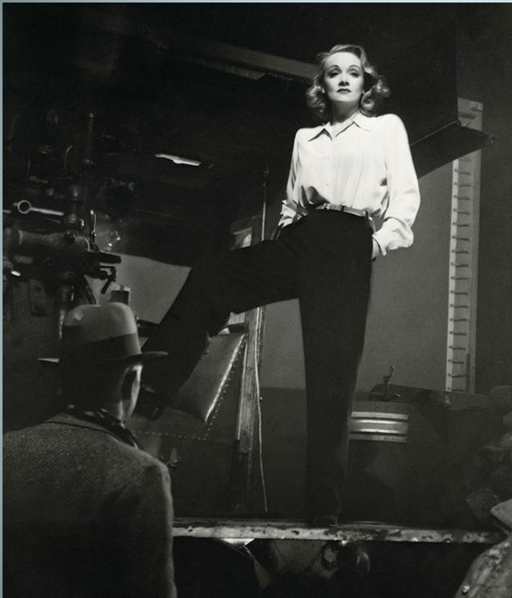
МАРЛЕН ДИТРИХ В ФИЛЬМЕ «СЕМЬ ГРЕШНИКОВ», 1940