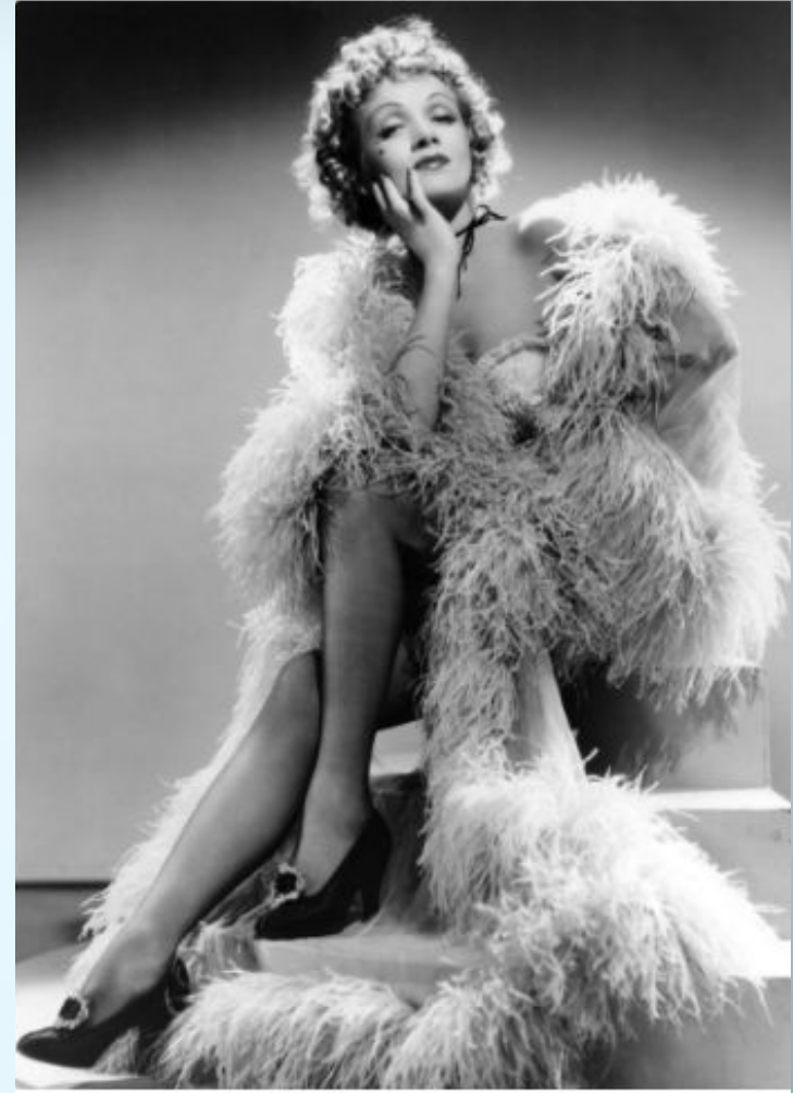
М. Дитрих. Ок 1936