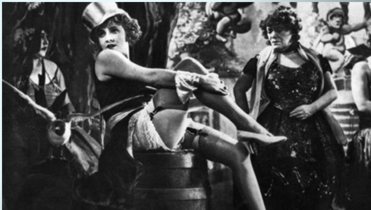
Кадр из к/ф «Голубой ангел»