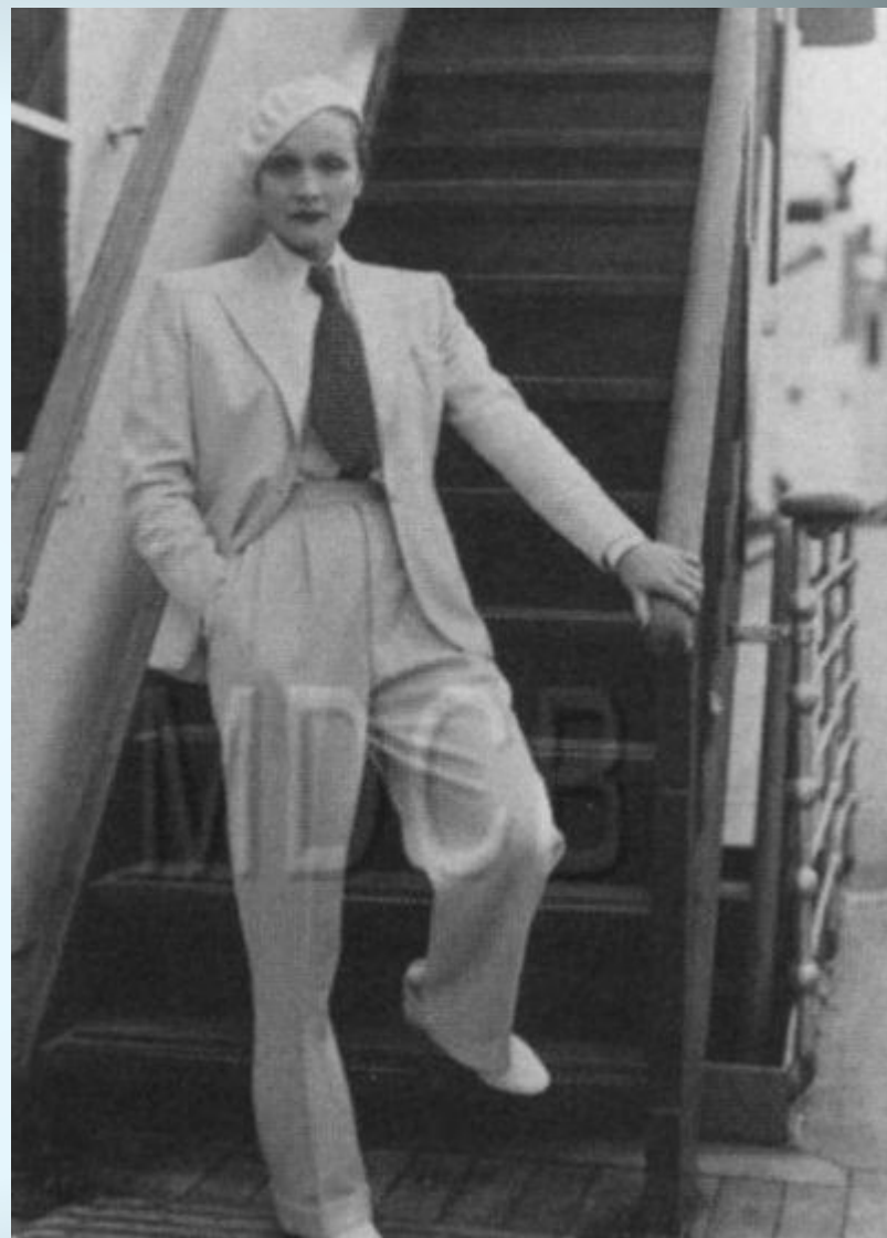
М. Дитрих 1931 г.