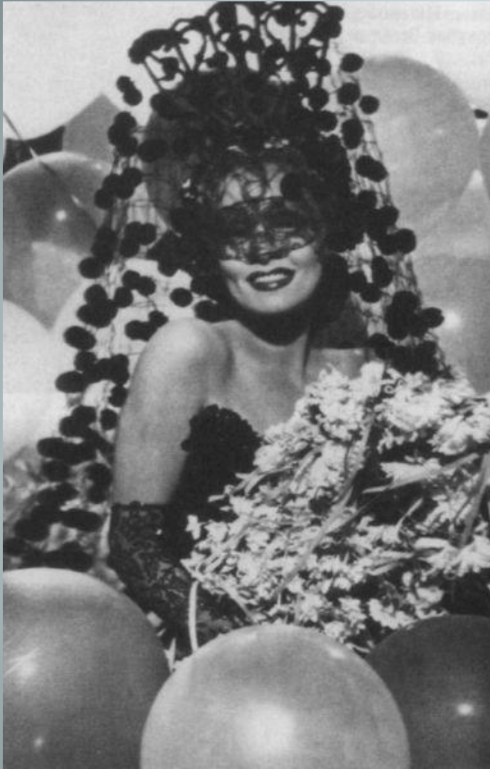
М.Дитрих в фильме Штернберга «Дьявол — это женщина». 1935 г.