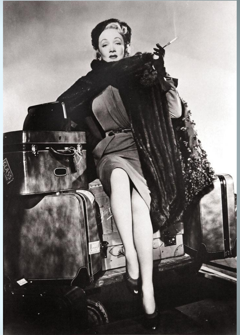
М.Дитрих. Ок 1940