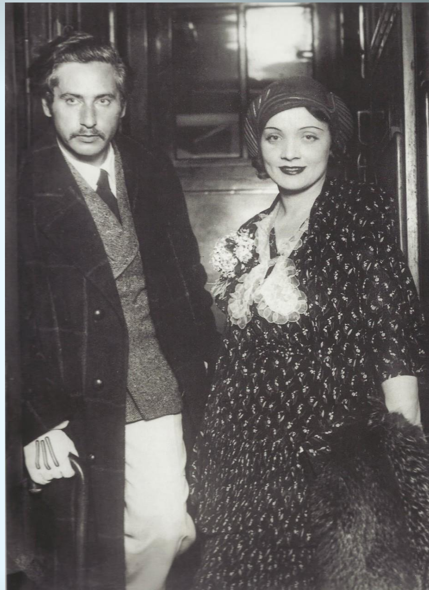
Джозеф фон Штернберг и Марлен Дитрих. 1930