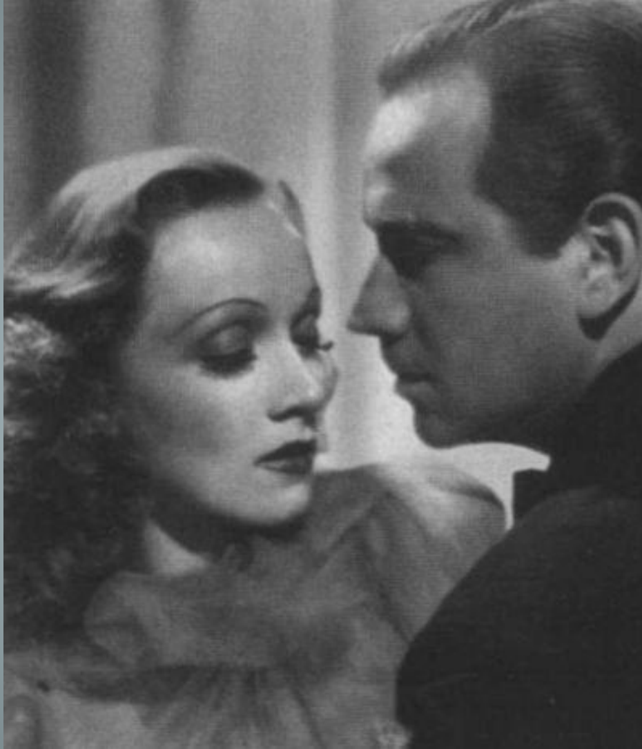
Марлен Дитрих и Мелвин Дуглас в фильме Эрнста Любича «Ангел». 1937 г.