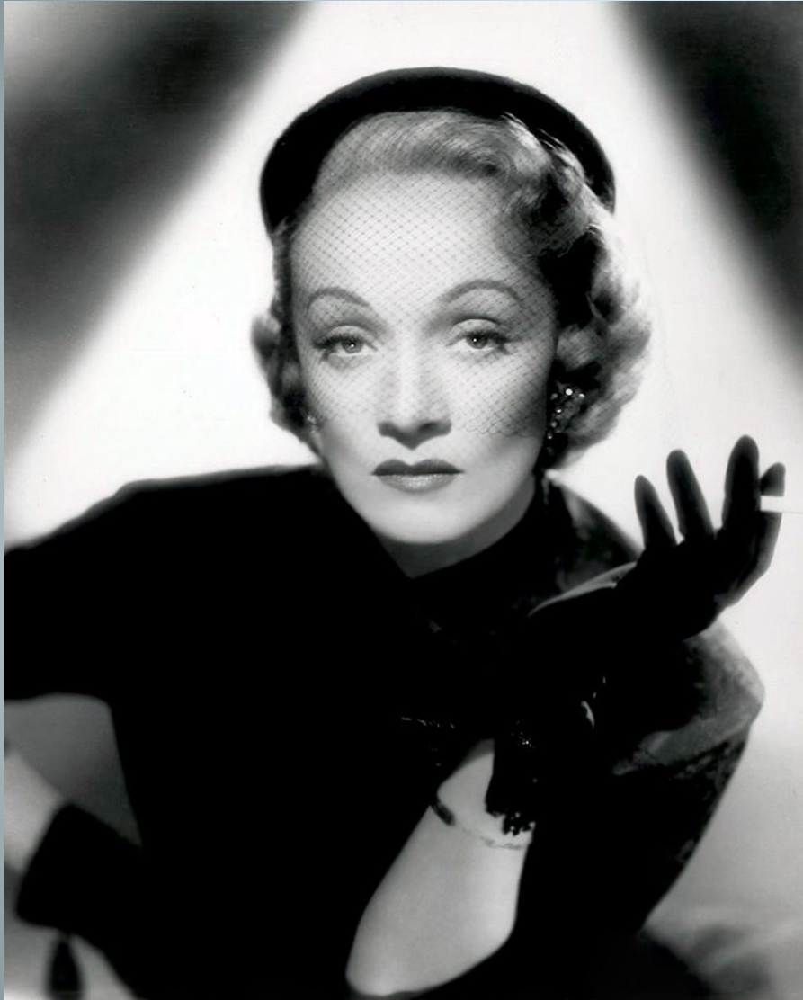
Марлен Дитрих. Ок 1938 г.