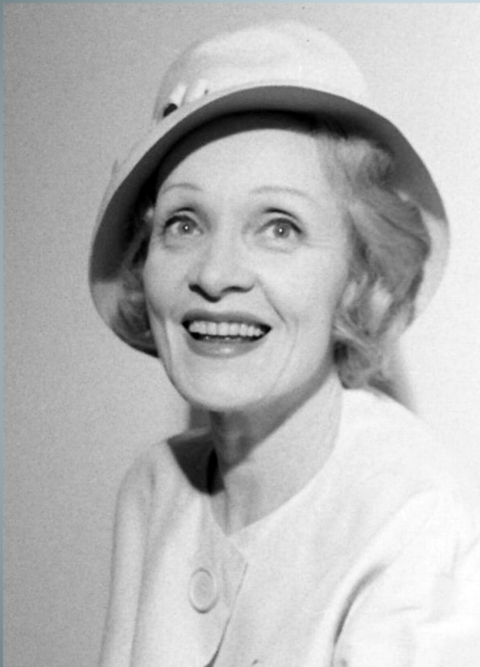
Марлен Дитрих 1960 г.