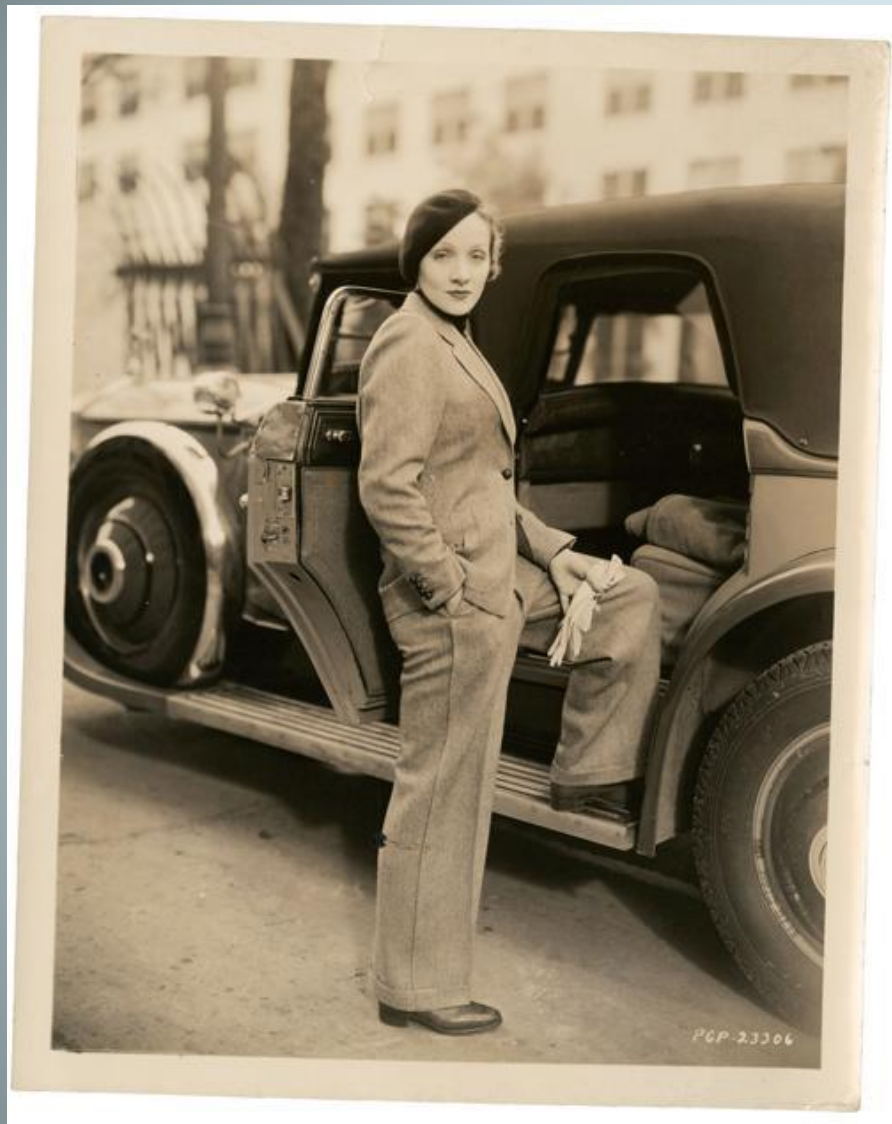
М. Дитрих 1930 г.