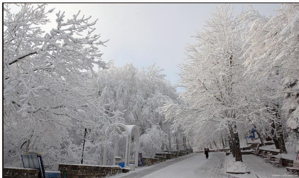
На центральной аллее парка

Сегодня сердце Железноводска – это Лечебный парк. Он большой, в нем много зелени и чистый воздух.