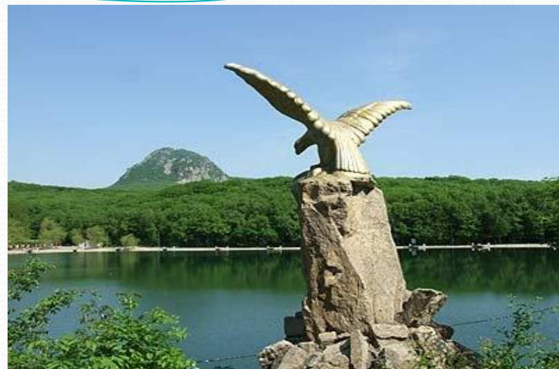
Символ города Железноводска

В нашем городе даже жил великий русский поэт Михаил Юрьевич Лермонтов.