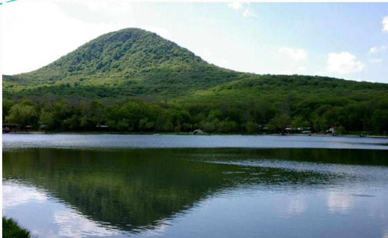
Городское озеро и вид на гору Железная

Город со всех сторон окружен горами: Железной, Бештау, Змейкой, Кинжалом, Верблюдкой. В ясную погоду видны белоснежные вершины красавца Эльбруса!