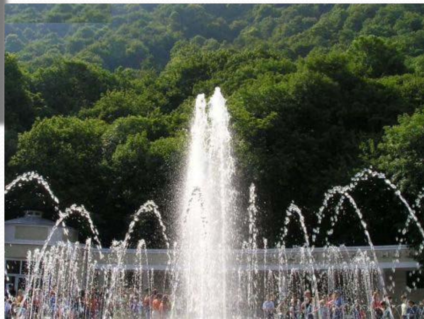
Цветной фонтан в парке

В нем есть два бювета с водой, красивый фонтан,