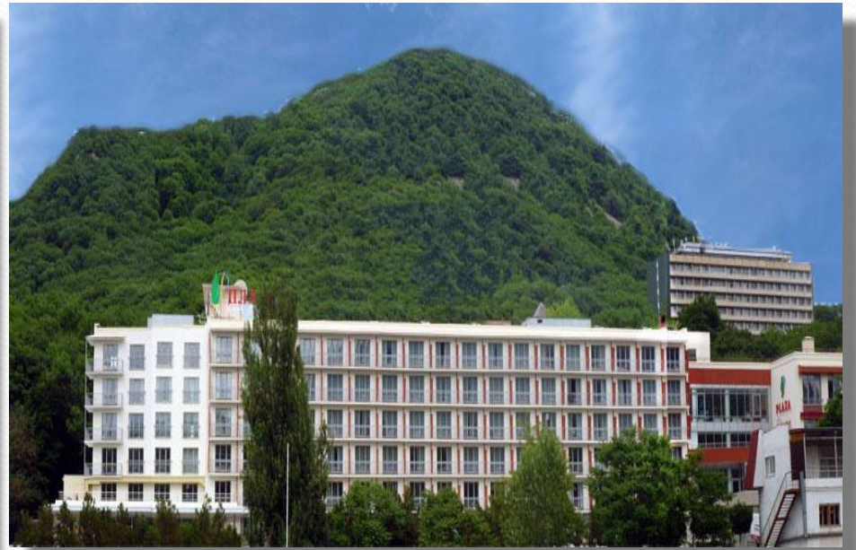
Санаторий им. Э. Тельмана (1907г. постройки)