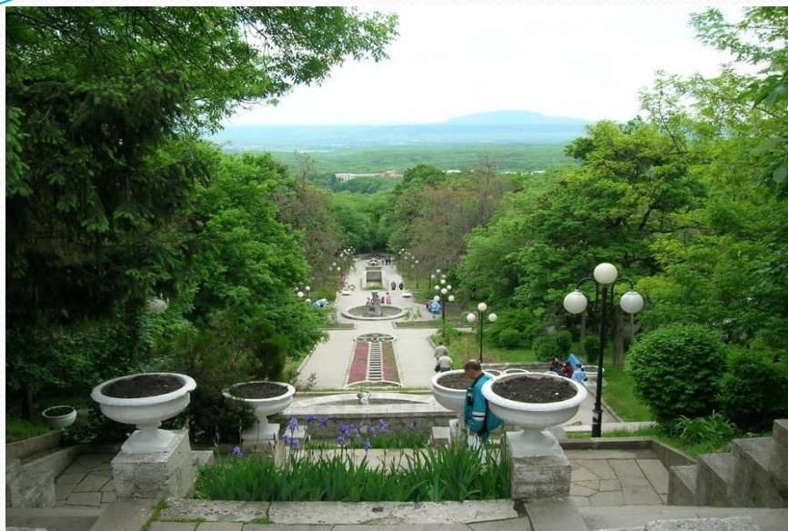
Каскадная лестница в парке

Сегодня сердце Железноводска – это Лечебный парк. Он большой, в нем много зелени и чистый воздух.