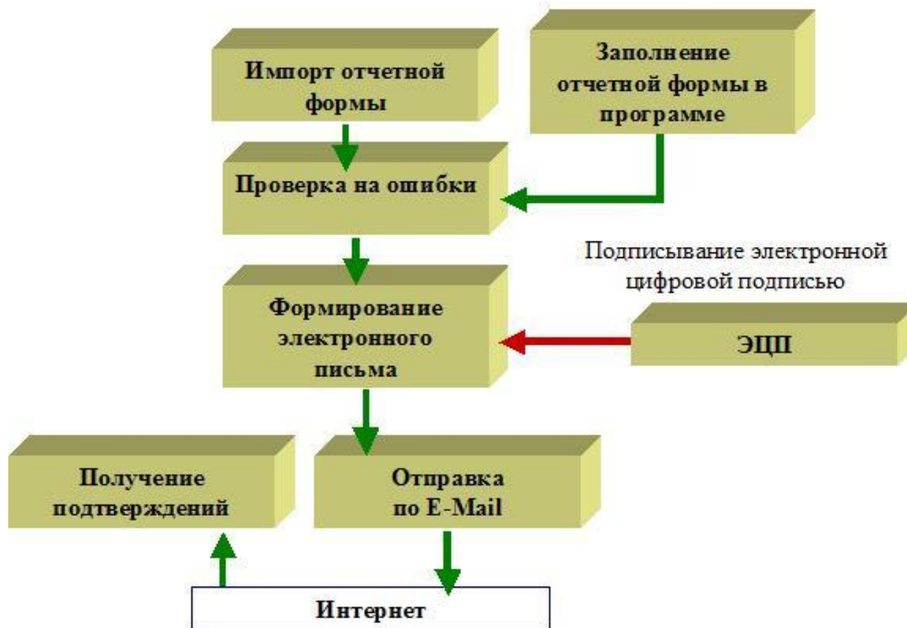
Схема прохождения документов в системе электронного документооборота СБИС++ фирмы ООО «Тензор»