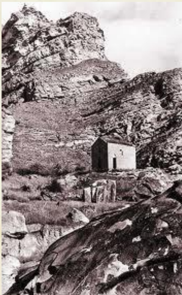
селение Цада Хунзахского