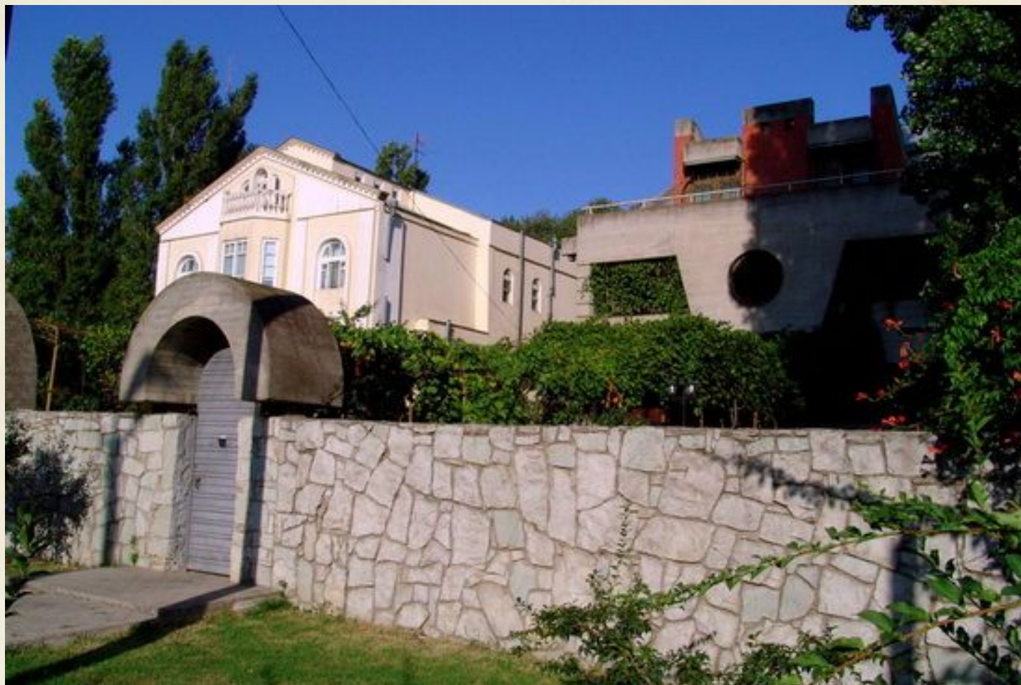
дом где жил Расул Гамзатов